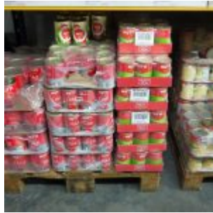
Tomatenprodukte von Mutti