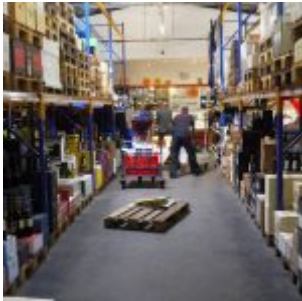
In der Halle