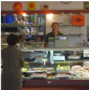
Der schwer kontrollierbare Einkauf

Obwohl das Centro Soriano schon seit 1992 in Düsseldorf gibt, bin ich erst vor wenigen Jahren auf dieses Wunderland der italienischen Delikatessen gestoßen. Und zwar bei der Suche nach der ultimativen Salsiccia. Die gibt's ja inzwischen auch beim guten Metzger und im Allzweck-Delikatessen-Laden. Ja, sogar diese so genannten „Fleischboutiquen“ legen die italienische Bratwurst neben die Steaks aus aller Rinder Länder. Tatsächlich habe ich vieles probiert, und wenig hat mich überzeugt. Am Ende hat dann Soriano gesiegt, weil hier jeden Dienstag frisch aus den Abruzzen gelieferte Salsiccia im Kühlschrank liegt, die einfach