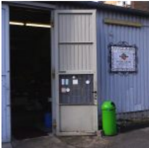
Eingang zur Halle an der Ackerstraße