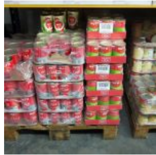
Tomatenprodukte von Mutti