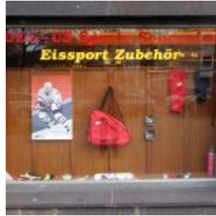
Das legendäre Schaufenster