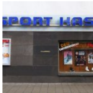
Eissport Kasper im Eisstadion an der Brehmstraße