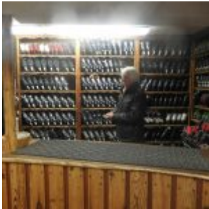
Die Kaspers hinterm Tresen