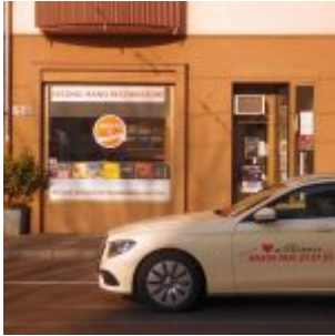
Auf der Düsseldorf Straße