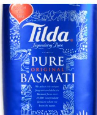
Mein geliebter Basmati von Tilda

Wenn es eines Beweises bedurft hätte, dass Tat's Asia Markt auf dem Fürstenwall gleich um die Ecke zur Corneliusstraße eine perfekte Quelle für asiatische Zutaten ist, dann kann man sich diesen an jedem Wochenende holen. Denn dann kommen Menschen asiatischer Herkunft aus weitem Umkreis nach Friedrichstadt, um bei Tat die Produkte einzukaufen, die sie für ihre kulturtypischen Gerichte brauchen. Nein, dieser unscheinbare Laden kann in der Größe nicht mit diesem asiatischen Supermärkten mithalten, von denen sich in jeder Großstadt zwei bis drei finden. Aber das will der Inhaber auch gar nicht. Es geht ihm um die Auswahl und die Qualität.