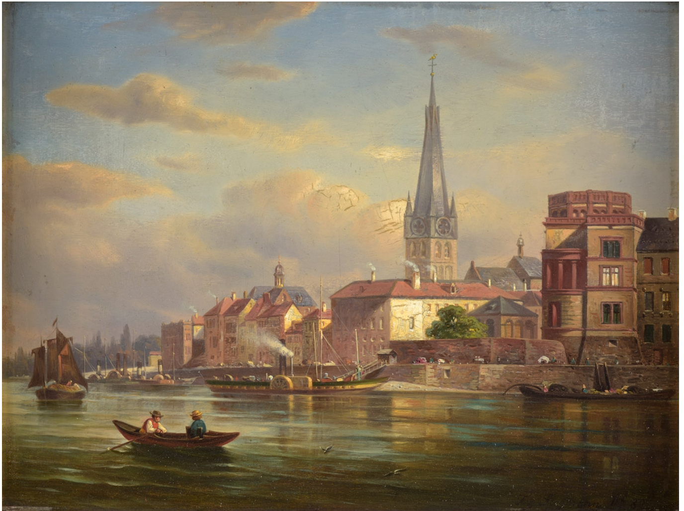
Die Düsseldorfer Rheinfront um 1882 auf einem Gemälde von Franz Stegmann (via Wikimedia, public domain)

Übrigens: Das beschriebene Bevölkerungswachstum jener Epoche lässt sich nicht – wie ab 1909 – durch Eingemeindungen erklären. 1394 waren Bilk, Derendorf und Golzheim hinzugekommen, 1394 Hamm und 1487 Volmerswerth. Danach waren keine weiteren Dörfer zur Stadt geholt worden. Immer mehr Menschen bevölkerten Düsseldorf, weil einerseits die Geburtenraten ab etwa 1830 enorm hoch waren und weil zigtausend Menschen in die boomende Industriemetropole zuzogen.