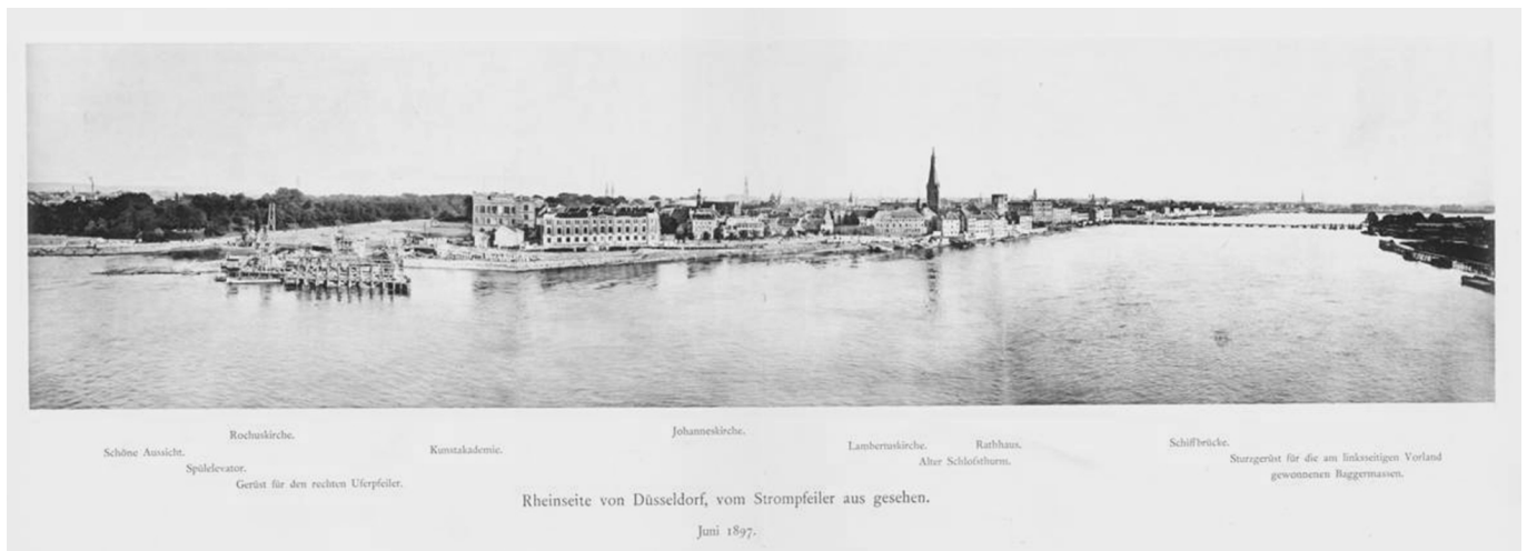
Rheinpanorama vom Juni 1897, aufgenommen vor der Rheinuferverschiebung

Zwei Faktoren lösten diesen Boom aus und befeuerten ihn Jahr für Jahr: einerseits die Tatsache, dass die Stadt Köln entsprechend der Mainzer Akte 1831 das Stapelrecht verlor und 1834 der deutsche Zollverein in Kraft trat, andererseits, dass Düsseldorf schon ab 1838 Knotenpunkt der ersten westdeutschen Eisenbahnstrecken war. Gleich 1831 richteten die Stadtoberen einen Freihafen ein, und innerhalb von nicht einmal zehn Jahren wurde Düsseldorf zu einem wichtigen Handelsplatz am Rhein.