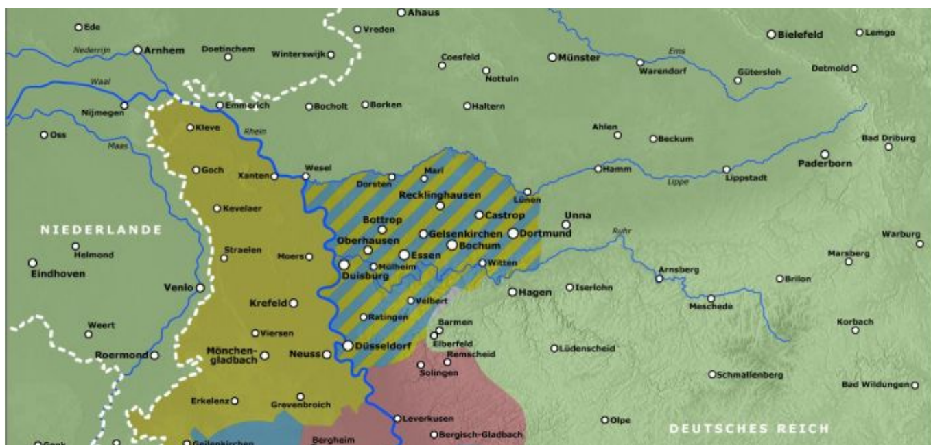
Französische und belgische Besatzungszone nach dem ersten Weltkrieg (Karte via Wikimedia)

Weil der Rhein bei Düsseldorf die Grenze zwischen den nicht besetzten Teilen des Deutschen Reiches und dem von Franzosen und Belgiern besetzten Rheinland bildete, wurden die Brücken von belgischen Truppen scharf bewacht; der Grenzverkehr zwischen Heerdt und dem Rest der Stadt war ohne besonderen Pass nicht möglich. Das alles löste den Unmut der linksrheinischen Bevölkerung aus. Nicht nur nationalistisch gesonnene Menschen übten deshalb ab etwa 1921 verschiedene Formen des passiven Widerstands aus. Das wiederum brachte erhebliche Spannungen zwischen den belgischen Soldaten und der Zivilbevölkerung aus.