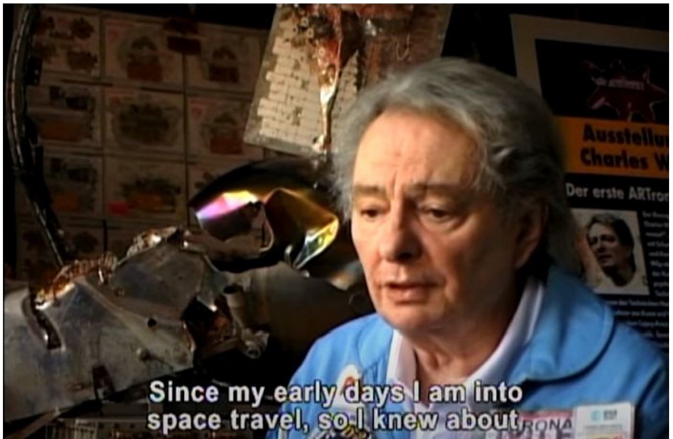
Wilp spricht über seine Leidenschaft für die Raumfahrt

Nach der Rückkehr aus Paris studierte Wilp solche für damalige Zeiten ungewöhnlichen Fächer wie Synästhesie und Wirkungspsychologie. Dazu aber auch weiterhin Kunst und zusätzlich Publizistik. Man kann sich Charles Wilp durchaus als Universalgenie vorstellen. Dass er ab 1963 dann ausgerechnet als Werbefotograf bekannt wurde, geschah eher zufällig und hatte seine Ursache vermutlich darin, dass viele Entscheider in den Unternehmen in den turbulenten Sechzigern das altmodische Abfotografieren leid waren und eben modern sein wollten.