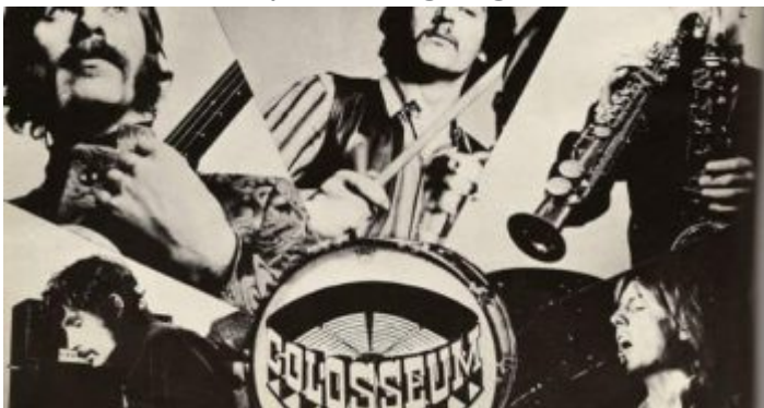
Colosseums Auftritt beeindruckte mich nachhaltig