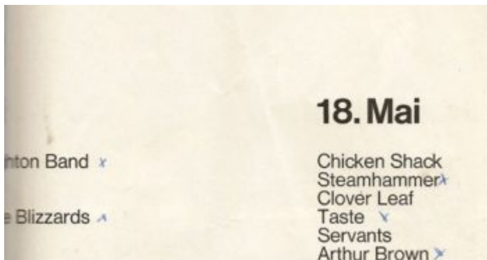
Das (theoretische) Programm für den Pfingstmontag...

Mensch eher zufällig von der Veranstaltung. Ja, es gab Plakate, sogar einige verschiedene, aber bei uns im Viertel hing davon keins. Wäre mein Schulfreund Harald nicht zufällig auf eine solche Ankündigung gestoßen, wer weiß, ob ich dieses Großereignis nicht doch verpasst hätte. Obwohl... Spätestens am Sonntagmittag wusste ganz Pempelfort, dass es im Eisstadion Live-Musik gab, denn die Lautstärke war groß genug halb Düsseldorf zu beschallen.