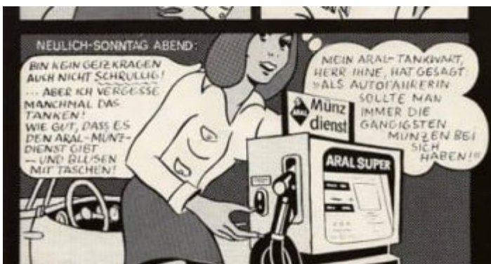
Kurios: Ein Werbefilm im Beiprogramm

Ansonsten gehen die Tage und Nächte sowie die Auftritte in der Erinnerungsabteilung meines Hirns aus verschiedenen Gründen durcheinander. Sicher bin ich nur, dass wir Edgar Broughton viele Minuten lang mit seinem „Out, demons, out!“ folgten. Die vollmundig angekündigten Eric Clapton mit Blind Faith tauchten jedenfalls ebenso wenig auf wie Vanilla Fudge. Dafür aber die holländischen Jungs von Livin Blues und Cuby & The Blizzards, die aber sowieso alle paar Monate in Düsseldorf aufspielten.