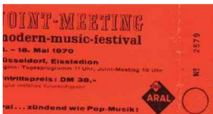
Eine Original-Dauerkarte für das Joint Meeting

Das war uns zu teuer: 38 Mark sollte die Dauerkarte für das dreitägige Rockfestival zu Pfingsten 1970 im Eisstadion an der Brehmstraße kosten. Wer sich aber im DEG-Tempel auskannte und/oder im Winter regelmäßig dort Eislaufen war, kannte Mittel und Wege auch so reinzukommen. Und so hatte von unserer Truppe, die sich an zwei der drei Tagen in der Ecke zwischen Gegengerade und Südtribüne traf, niemand bezahlt. Allerdings wurde der Einlass ohnehin äußerst lasch gehandhabt, und so etwas wie Security gab's auch nicht.