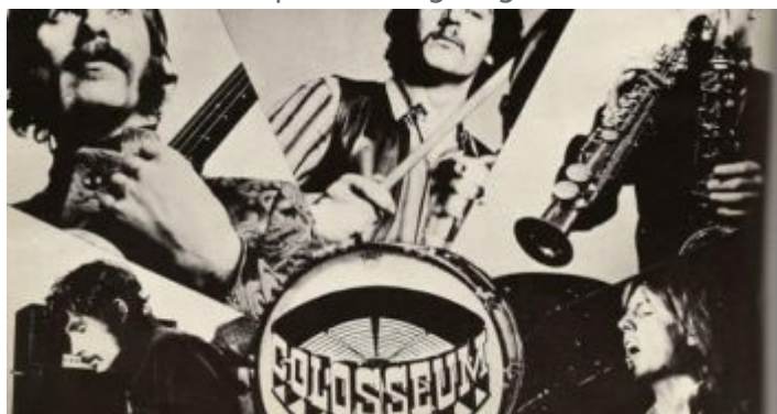
Colosseums Auftritt beeindruckte mich nachhaltig