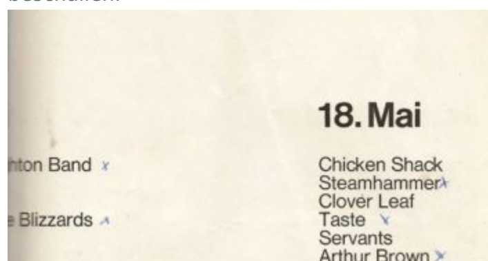
Das (theoretische) Programm für den Pfingstmontag...

Mensch eher zufällig von der Veranstaltung. Ja, es gab Plakate, sogar einige verschiedene, aber bei uns im Viertel hing davon keins. Wäre mein Schulfreund Harald nicht zufällig auf eine solche Ankündigung gestoßen, wer weiß, ob ich dieses Großereignis nicht doch verpasst hätte. Obwohl... Spätestens am Sonntagmittag wusste ganz Pempelfort, dass es im Eisstadion Live-Musik gab, denn die Lautstärke war groß genug halb Düsseldorf zu beschallen.