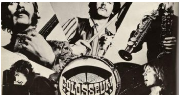
Colosseums Auftritt beeindruckte mich nachhaltig