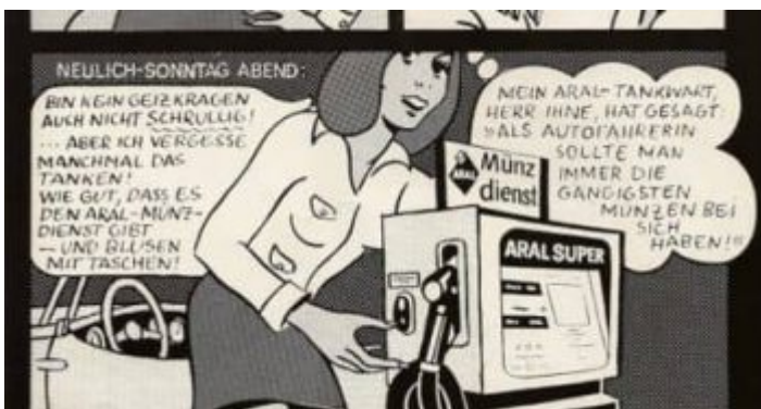
Kurios: Ein Werbefilm im Beiprogramm

Ansonsten gehen die Tage und Nächte sowie die Auftritte in der Erinnerungsabteilung meines Hirns aus verschiedenen Gründen durcheinander. Sicher bin ich nur, dass wir Edgar Broughton viele Minuten lang mit seinem „Out, demons, out!“ folgten. Die vollmundig angekündigten Eric Clapton mit Blind Faith tauchten jedenfalls ebenso wenig auf wie Vanilla Fudge. Dafür aber die holländischen Jungs von Livin Blues und Cuby & The Blizzards, die aber sowieso alle paar Monate in Düsseldorf aufspielten.