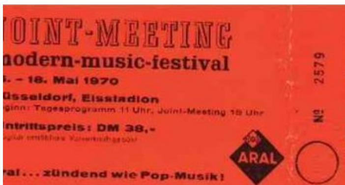
Eine Original-Dauerkarte für das Joint Meeting

Das war uns zu teuer: 38 Mark sollte die Dauerkarte für das dreitägige Rockfestival zu Pfingsten 1970 im Eisstadion an der Brehmstraße kosten. Wer sich aber im DEG-Tempel auskannte und/oder im Winter regelmäßig dort Eislaufen war, kannte Mittel und Wege auch so reinzukommen. Und so hatte von unserer Truppe, die sich an zwei der drei Tagen in der Ecke zwischen Gegengerade und Südtribüne traf, niemand bezahlt. Allerdings wurde der Einlass ohnehin äußerst lasch gehandhabt, und so etwas wie Security gab's auch nicht.