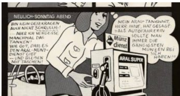
Kurios: Ein Werbefilm im Beiprogramm

Ansonsten gehen die Tage und Nächte sowie die Auftritte in der Erinnerungsabteilung meines Hirns aus verschiedenen Gründen durcheinander. Sicher bin ich nur, dass wir Edgar Broughton viele Minuten lang mit seinem „Out, demons, out!“ folgten. Die vollmundig angekündigten Eric Clapton mit Blind Faith tauchten jedenfalls ebenso wenig auf wie Vanilla Fudge. Dafür aber die holländischen Jungs von Livin Blues und Cuby & The Blizzards, die aber sowieso alle paar Monate in Düsseldorf aufspielten.