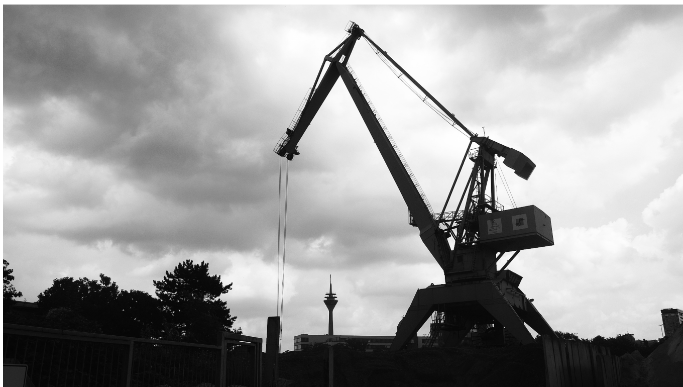
Hafenkran an Rheinturm

Nähert man sich der Stadt auf einer der Autobahnen im Westen, ist der Turm bei guter Sicht schon aus deutlich mehr als 20 Kilometern zu sehen. Umgekehrt: Bei gutem Wetter kann man in der Ferne den ziemlich genau 40 Kilometer entfernten Turm in Köln sehen, der ein halbes Jahr früher als unser Schmuckstück eingeweiht wurde, aber aus kölschen Gründen seit 1994 nicht mehr öffentlich zugänglich ist. Beide zählen zu den 27 von der Deutsche Funkturm GmbH, einer hundertprozentigen Tochter der Deutschen Telekom AG, betriebenen Sendeanlagen in NRW. Nachdem die rasche Ausbreitung der Glasfasernetze für das analoge Telefon die Bedeutung des Richtfunks in den Neunzigerjahren fast völlig beendet hatte, erlebte diese Technik durch das drahtlose Telefonieren ab etwa 2005 eine Renaissance, wobei inzwischen die Plätze an den Türmen vor allem für Antennen diverser Netzbetreiber vermietet werden.