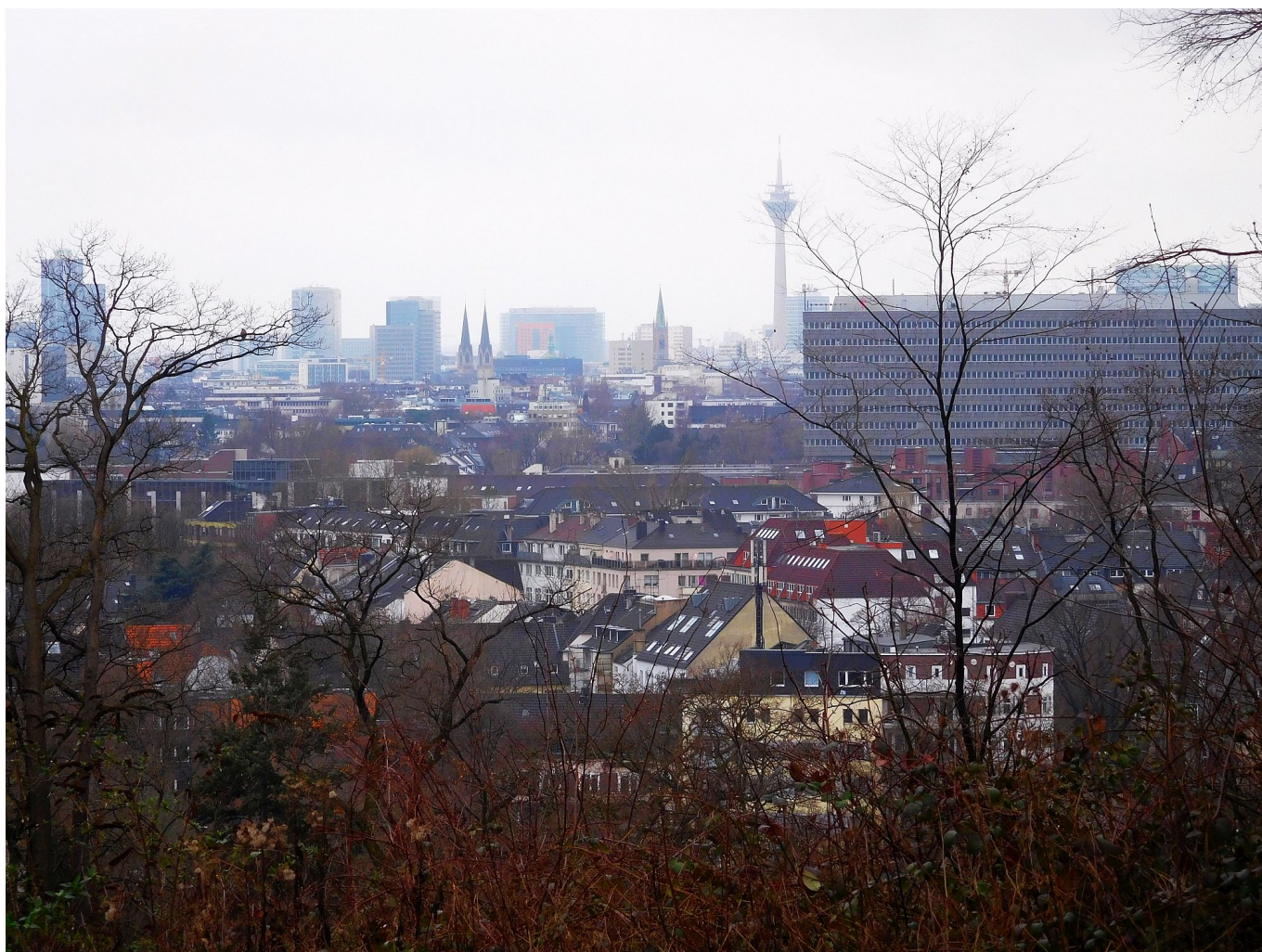
Der Ausblick Richtung Rheinturm und Stadttor

Das heißt im Klartext: Unser Rheinturm sieht nicht nur schön aus, er hat auch eine wichtige technische Funktion. Eine wirklich einmalige Installation aber ist die Dezimaluhr , die von Norden aus zu sehen ist und durch die Beleuchtung von 39 der insgesamt 62 Luken dargestellt wird. Offiziell heißt die vom Künstler Horst H. Baumann geschaffene Skulptur „Lichzeitpegel,,“ und ächte Düsseldorfer:innen wissen natürlich, wie man daran die Uhrzeit abliest ... und erklären es Gästen gern. Wenige wissen, dass der Lichtzeitpegel schon seit dem November 1981 die Zeit anzeigt, also einige Monate vor der Einweihung des Turms. Um der Wahrheit die Ehre zu geben: Es handelt sich natürlich nicht um die einzige Dezimaluhr der Welt, aber laut dem Guinness-Buch um die größte.