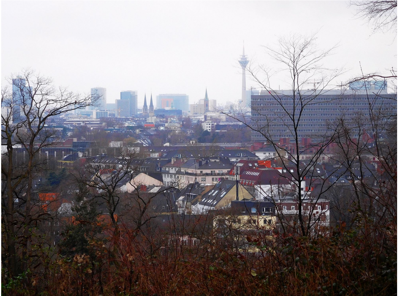
Der Ausblick Richtung Rheinturm und Stadttor

Das heißt im Klartext: Unser Rheinturm sieht nicht nur schön aus, er hat auch eine wichtige technische Funktion. Eine wirklich einmalige Installation aber ist die Dezimaluhr , die von Norden aus zu sehen ist und durch die Beleuchtung von 39 der insgesamt 62 Luken dargestellt wird. Offiziell heißt die vom Künstler Horst H. Baumann geschaffene Skulptur „Lichzeitpegel,,“ und ächte Düsseldorfer:innen wissen natürlich, wie man daran die Uhrzeit abliest ... und erklären es Gästen gern. Wenige wissen, dass der Lichtzeitpegel schon seit dem November 1981 die Zeit anzeigt, also einige Monate vor der Einweihung des Turms. Um der Wahrheit die Ehre zu geben: Es handelt sich natürlich nicht um die einzige Dezimaluhr der Welt, aber laut dem Guinness-Buch um die größte.