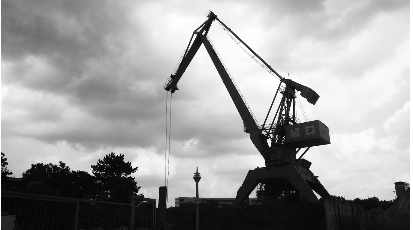
Hafenkran an Rheinturm

Nähert man sich der Stadt auf einer der Autobahnen im Westen, ist der Turm bei guter Sicht schon aus deutlich mehr als 20 Kilometern zu sehen. Umgekehrt: Bei gutem Wetter kann man in der Ferne den ziemlich genau 40 Kilometer entfernten Turm in Köln sehen, der ein halbes Jahr früher als unser Schmuckstück eingeweiht wurde, aber aus kölschen Gründen seit 1994 nicht mehr öffentlich zugänglich ist. Beide zählen zu den 27 von der Deutsche Funkturm GmbH, einer hundertprozentigen Tochter der Deutschen Telekom AG, betriebenen Sendeanlagen in NRW. Nachdem die rasche Ausbreitung der Glasfasernetze für das analoge Telefon die Bedeutung des Richtfunks in den Neunzigerjahren fast völlig beendet hatte, erlebte diese Technik durch das drahtlose Telefonieren ab etwa 2005 eine Renaissance, wobei inzwischen die Plätze an den Türmen vor allem für Antennen diverser Netzbetreiber vermietet werden.