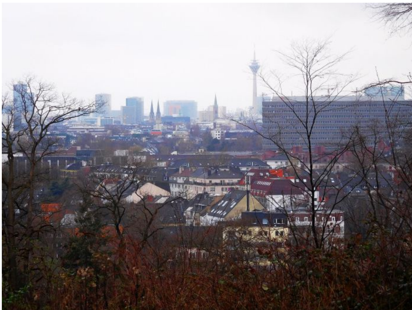
Der Ausblick Richtung Rheinturm und Stadttor

Das heißt im Klartext: Unser Rheinturm sieht nicht nur schön aus, er hat auch eine wichtige technische Funktion. Eine wirklich einmalige Installation aber ist die Dezimaluhr , die von Norden aus zu sehen ist und durch die Beleuchtung von 39 der insgesamt 62 Luken dargestellt wird. Offiziell heißt die vom Künstler Horst H. Baumann geschaffene Skulptur „ Lichtzeitpegel “, und ächte Düsseldorfer:innen wissen natürlich, wie man daran die Uhrzeit abliest ... und erklären es Gästen gern. Wenige wissen, dass der Lichtzeitpegel schon seit dem November 1981 die Zeit anzeigt, also einige Monate vor der Einweihung des Turms. Um der Wahrheit die Ehre zu geben: Es handelt sich natürlich nicht um die einzige Dezimaluhr der Welt, aber laut dem Guinness-Buch um die größte.