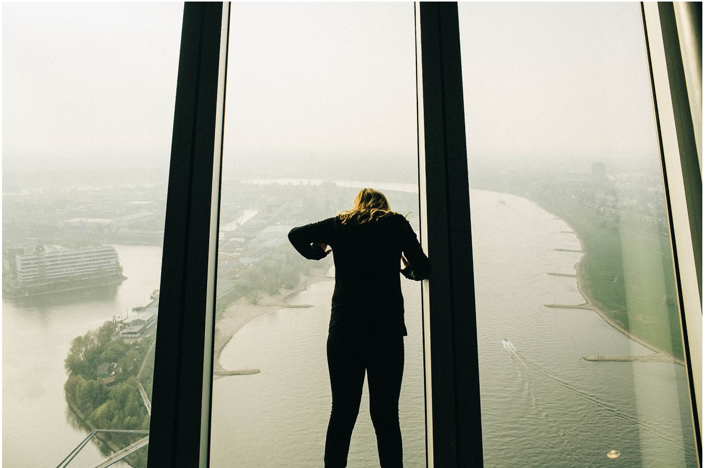
Mutprobe: Die schrägen Scheiben im Rheinturm

Aus heutiger Sicht kann man sagen: Absolut gelungen! Ja, nicht wenige Menschen halten unseren Rheinturm für den ästhetisch wertvollsten unter seinesgleichen. Eine weitere Vorgabe des Stadtrates war, dass der Turm öffentlich zugänglich sein und dass es im Turmkorb gastronomische Einrichtungen geben sollte. Das brachte den Bedarf nach einem publikumsfreundlichen Aufzug mit sich und führte zur Installation einer sich drehenden Restaurantebene.