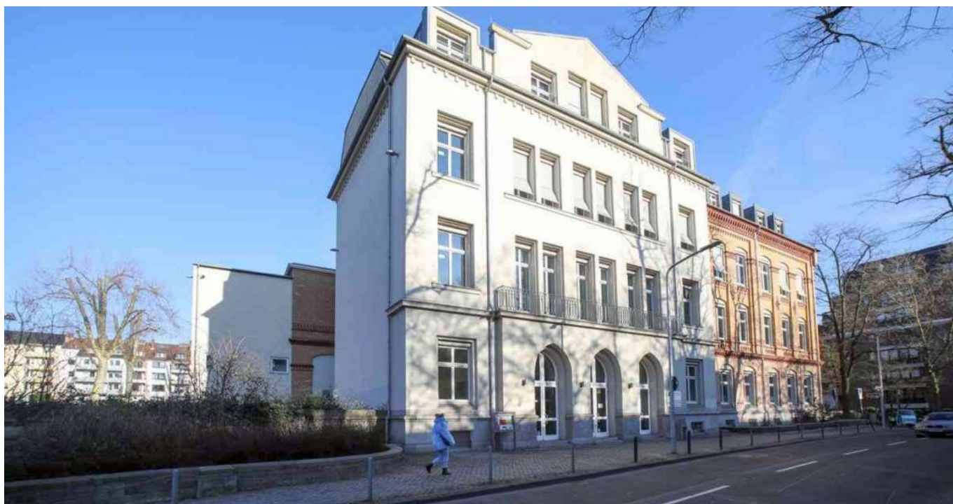
Das ehemalige Theaterhaus als Clara-Schumann-Musikschule