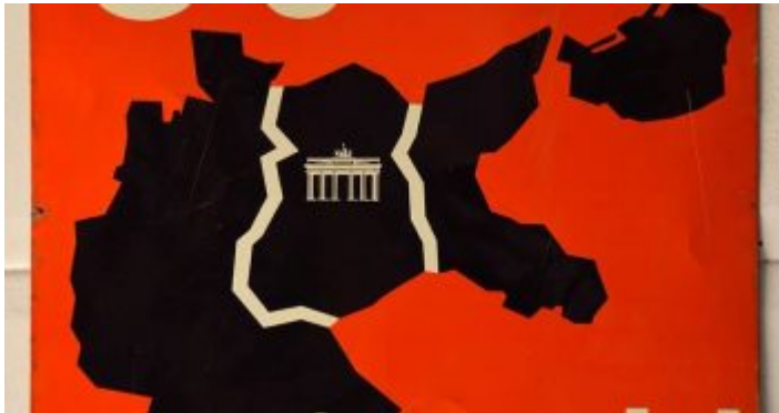
Das Plakat mit der revanchistischen Parole „3 geteilt? Niemals!“

Welche Dimensionen diese Vertriebenenlobby hatte, mag man daran ermessen, dass am Bundestreffen der Ostpreußen am 9./10. Juli 1960 im Rheinstadion mehr als 200.000 Menschen teilnahmen. Gerade die „Landsmannschaften“ deren Heimat östlich der Grenzen der DDR lag, waren besonders revanchistisch, was das Kuratorium Unteilbares Deutschland Ende der Fünfzigerjahre mit dem Slogan „3 geteilt? Niemals!“ aufgriff. Wie wir heute wissen, verschwand die Idee der „Rückeroberung“ der sogenannten „deutschen Ostgebiete“ erst im Zuge der Ostpolitik von Willy Brandt und der Aussöhnung mit den östlichen Nachbarn.