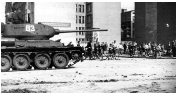
17. Juni 1953: Sowjetische Panzer gegen protestierende Arbeiter in Ostberlin

Warum es so wichtig war, das DDR-Regime zu kippen, ließ sich an der Geschichte des 17. Juni 1953 bestens ablesen. Damals hatte die Stalinisten, die in den DDR-Gremien die Oberhand hatten, einen Arbeiteraufstand blutig niederschlagen lassen und damit die hässliche Fratze des angeblichen „Kommunismus“ stalinistischer Auslegung demaskiert. Dabei richtete sich der Aufstand gar nicht gegen den Sozialismus, der ja das Staatssystem der Deutschen Demokratischen Republik werden sollte, sondern gegen die hartleibigen Funktionäre, denen die miesen Lebensumstände des Proletariats schnurz waren und die jegliche Bemühungen um wirkliche Mitbestimmung durch die Arbeiter überall und jederzeit unterdrückten.