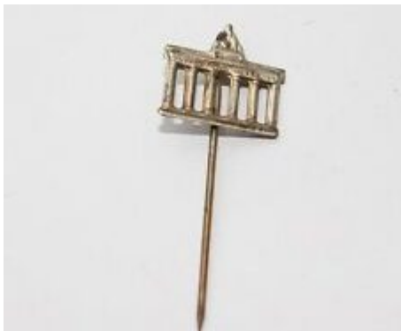
Die berühmte Anstecknadel mit dem Brandenburger Tor

Welche Dimensionen diese Vertriebenenlobby hatte, mag man daran ermessen, dass am Bundestreffen der Ostpreußen am 9./10. Juli 1960 im Rheinstadion mehr als 200.000 Menschen teilnahmen. Gerade die „Landsmannschaften“ deren Heimat östlich der Grenzen der DDR lag, waren besonders revanchistisch, was das Kuratorium Unteilbares Deutschland Ende der Fünfzigerjahre mit dem Slogan „3 geteilt? Niemals!“ aufgriff. Wie wir heute wissen, verschwand die Idee der „Rückeroberung“ der sogenannten „deutschen Ostgebiete“ erst im Zuge der Ostpolitik von Willy Brandt und der Aussöhnung mit den östlichen Nachbarn.