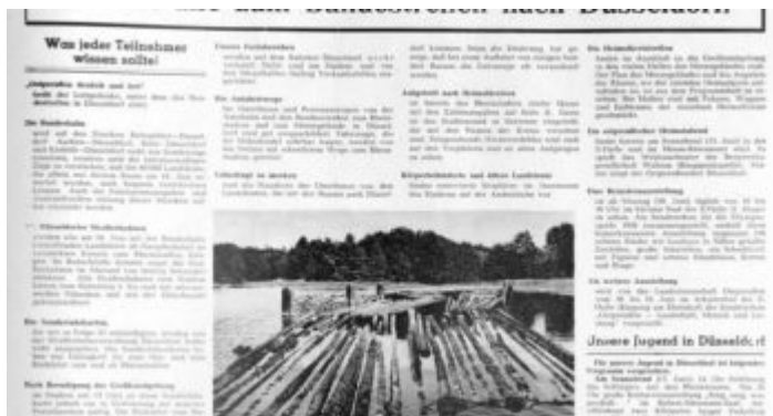
Aufruf zum Bundestreffen der Ostpreußen in Düsseldorf