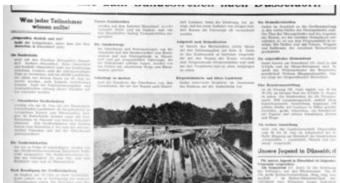
Aufruf zum Bundestreffen der Ostpreußen in Düsseldorf