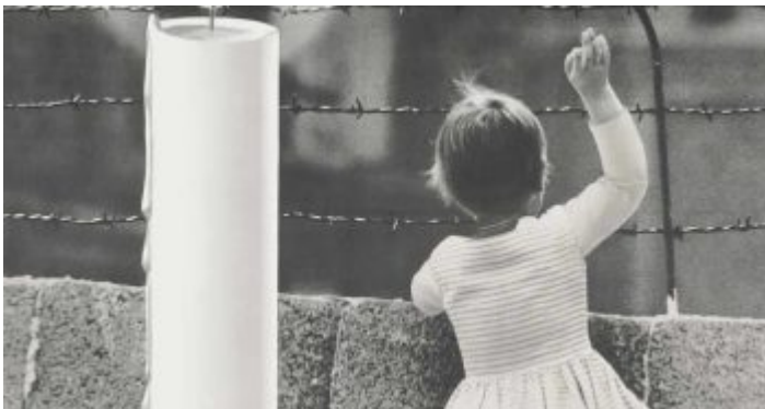
Der allgegenwärtige Stacheldraht...

Ja, vom Marketing verstanden die Leute vom Kuratorium Unteilbares Deutschland wirklich etwas. Nach dem Bau der Mauer in Berlin und dem Ausbau der Zonengrenze mit Todesstreifen ab dem August 1963 hatte die Organisation das Thema „Wiedervereinigung“ in den Vordergrund gestellt; auch weil die Identifikation der ehemaligen „Vertriebenen“ mit ihren Verbänden dramatisch abgenommen hatte. Noch um die Wende zwischen der Fünfziger- und Sechzigerjahre war es ein Dauerthema bei Familienfeiern: „Ach, wie gern würde ich noch einmal die Heimat sehen!“ war ein oft gehörter Seufzer, besonders bei den Ostpreußen und den Schlesiern bzw. Oberschlesiern. Mein Vater, der politisch eher links stand und mit dem sentimental Heimatgequatsche wenig anfangen konnte, sagte dann gern: „Und, würdest du dahin ziehen, wenn du könntest?“ Und schon war eine heftige Diskussion über die bösen Kommunisten und die guten Amerikaner im Gange.