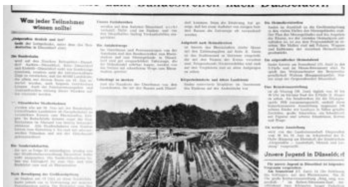
Aufruf zum Bundestreffen der Ostpreußen in Düsseldorf