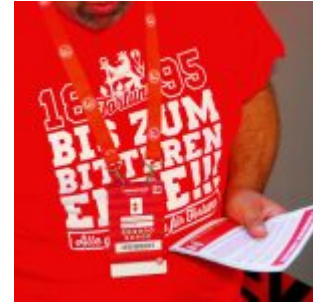
Bis zum bitteren Ende