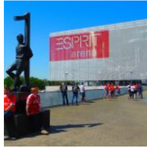
Toni passt auf