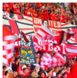
Zum letzten Mal Block 42