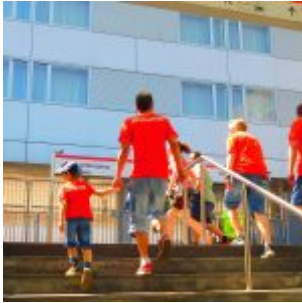
Vater und Sohn