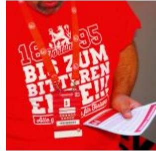
Bis zum bitteren Ende