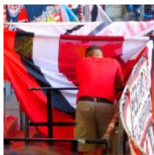
Kapo in der Pause