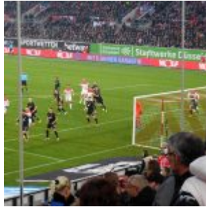
F95 vs Werder: Letzte Angriffsbemühungen