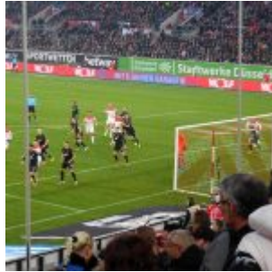
F95 vs Werder: Letzte Angriffsbemühungen