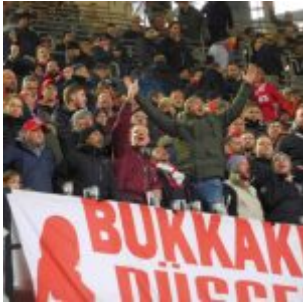
Der wilde Oberrang