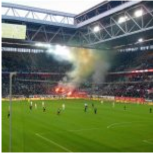
Was ist grün und stinkt nach Fisch?