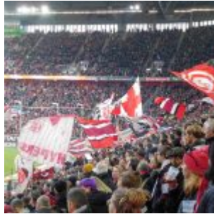
Unsere Süd