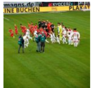
Ein- oder Auflaufkinder