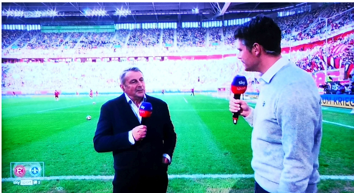
Klaus Allofs erklärt dem Sky-Reporter die Welt