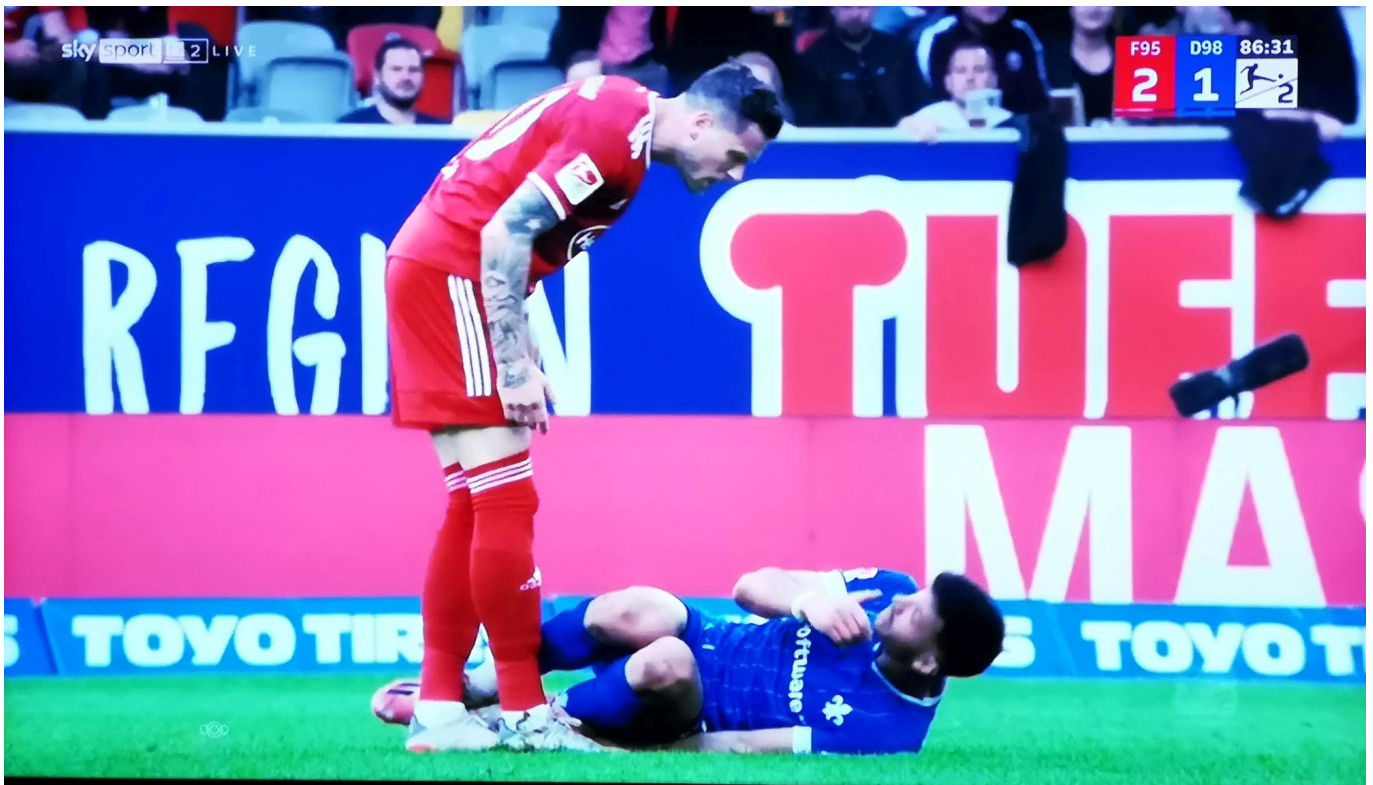
Ginczek lässt sich provozieren