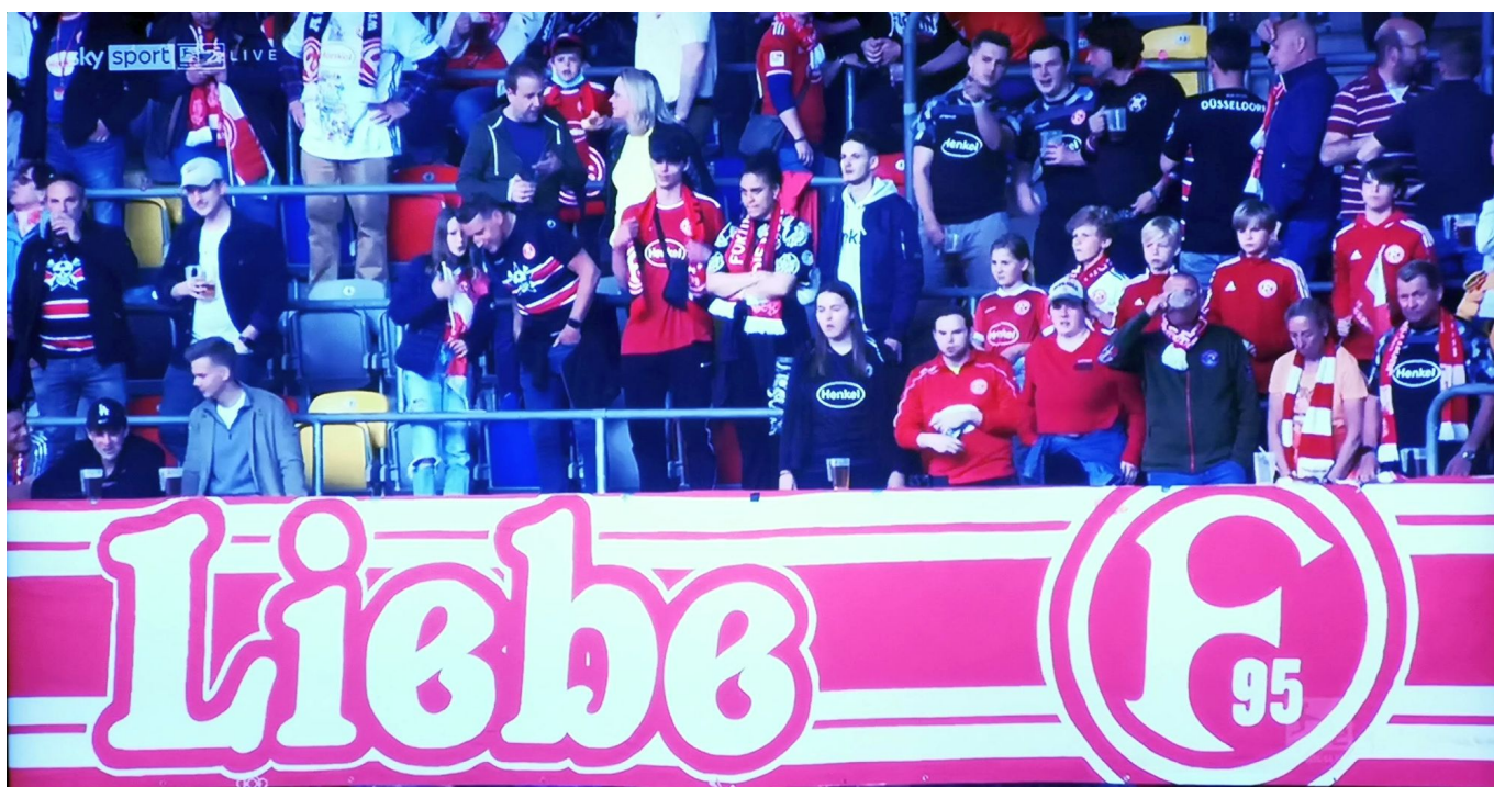
Der Block zeigt Liebe

Emma das Vertrauen zu geben, war ein genialer Schachzug, wobei DT später zugab, er habe da nicht lange drüber nachgedacht, sondern sehr kurzfristig aus dem Bauch heraus entschieden. Scheint ja überhaupt nicht schlecht zu sein, aufs Gedärm zu hören, denn zum dritten Mal in Folge hat der Bauch des Ergebenen das richtige Ergebnis vorhergesagt. So nebensächlich die Berufung vom jungen Iyoha ganz nach vorn zunächst erscheint, weist sie doch auf etwas hin, was der nun zwölfmal ungeschlagene und strunzsympathische Cheftrainer schon mehrfach hat anklingen lassen: Die gewählte Systematik kann in vielen Spielen völlig unwichtig sein.