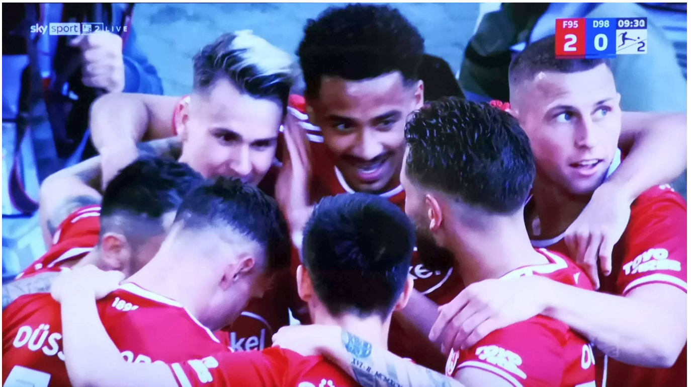
Glückliche Fortunen jubeln nach dem 2:0 (Screenshot Sky)

Part, war grandios in der Balleroberung ... auch wenn ihm selbst mit der ihm eigenen Hektik manches Mal die Pille wieder verlor.