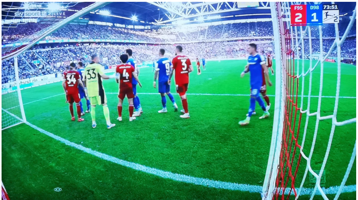
Ecke für Darmstadt

In der 31. Minute war das 3:0 fällig – es fiel aber nicht. Ausgangspunkt war ein feiner Diagonallpass von Klarer auf Appelkamp, der kurz auf Klaus im Sechzehner ablegt. Leider geht dessen Schuss an den Pfosten. Mehr 3:0-Möglichkeit gefällig? Ähnliche Kombination in der 37. Minute: Klaus braucht ein bisschen zu lang zum Abschluss. Und doch kann von einem Chancenwucher nicht die Rede sein – dafür waren die Möglichkeiten nicht klar genug. Einziges Manko der ersten Halbzeit war, dass Iyoha zu selten im Strafraum anspielbar war, obwohl er doch einige Freiheiten der überforderten SVD-Defensive genoss.