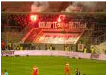
März 2019: F95 vs SGE: Bisschen Pyro