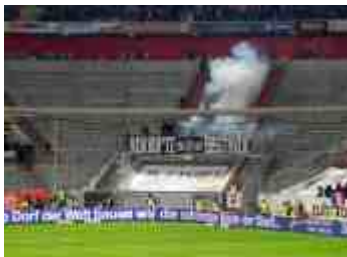
F95 vs Frankfurt - Auftritt mit Knalleffekt