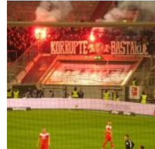
März 2019: F95 vs SGE: Bisschen Pyro

F95 vs Frankfurt – Auftritt mit Knalleffekt