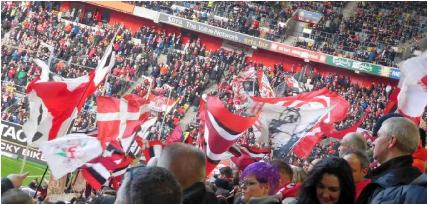
Block 40 ff

Natürlich war die Enttäuschung über die verschenkten zwei Punkte nach dem Schlusspfeif groß; und das wird immer so sein, wenn der fußballgottverfluchte Videobescheiß eine Partie entscheidet. Gleichzeitig waren sich die Freunde des wunderbarsten Fußballclubs am Rhein aber auch einig: Das hat Spaß gemacht, und das macht Hoffnung. Der Glaube an den Nichtabstieg ist trotz des Erwerbs von nur einem Punkt wieder erheblich gestiegen. Wie groß der Anteil von Trainer Rösler nach zuvor lediglich zwei Trainingseinheiten gewesen ist, wird man erst nach dem Ende der Saison beurteilen können. So wie die Dinge liegen, werden sich in der Sommerpause aber einige Dinge ändern, und F95 könnte personell ganz anders beschaffen in die Saison 20/21 starten.