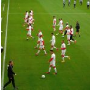
Men in White