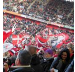
Block 40 ff