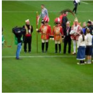
Dä Prinz kütt