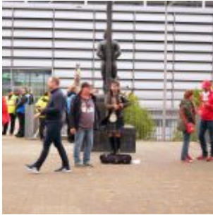
Dudelsack gegen Depression