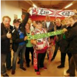
Als uns die Freunde von ADO Den Haag im September 2019 besuchten