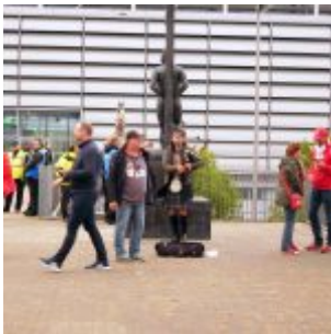
Dudelsack gegen Depression