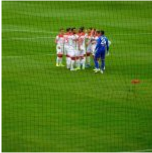
F95 vs Freiburg: Mannschaftskreis