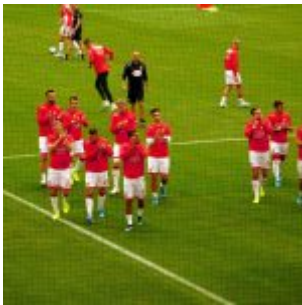
Begrüßung der Süd