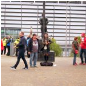
Dudelsack gegen Depression