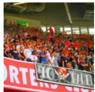
Die da oben