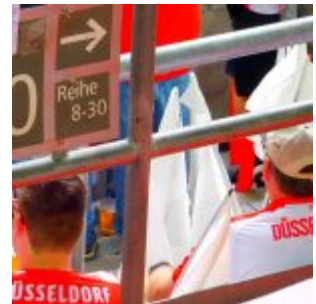
Blok 40 unten