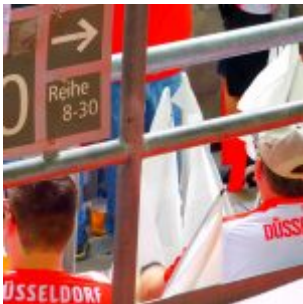
Blok 40 unten