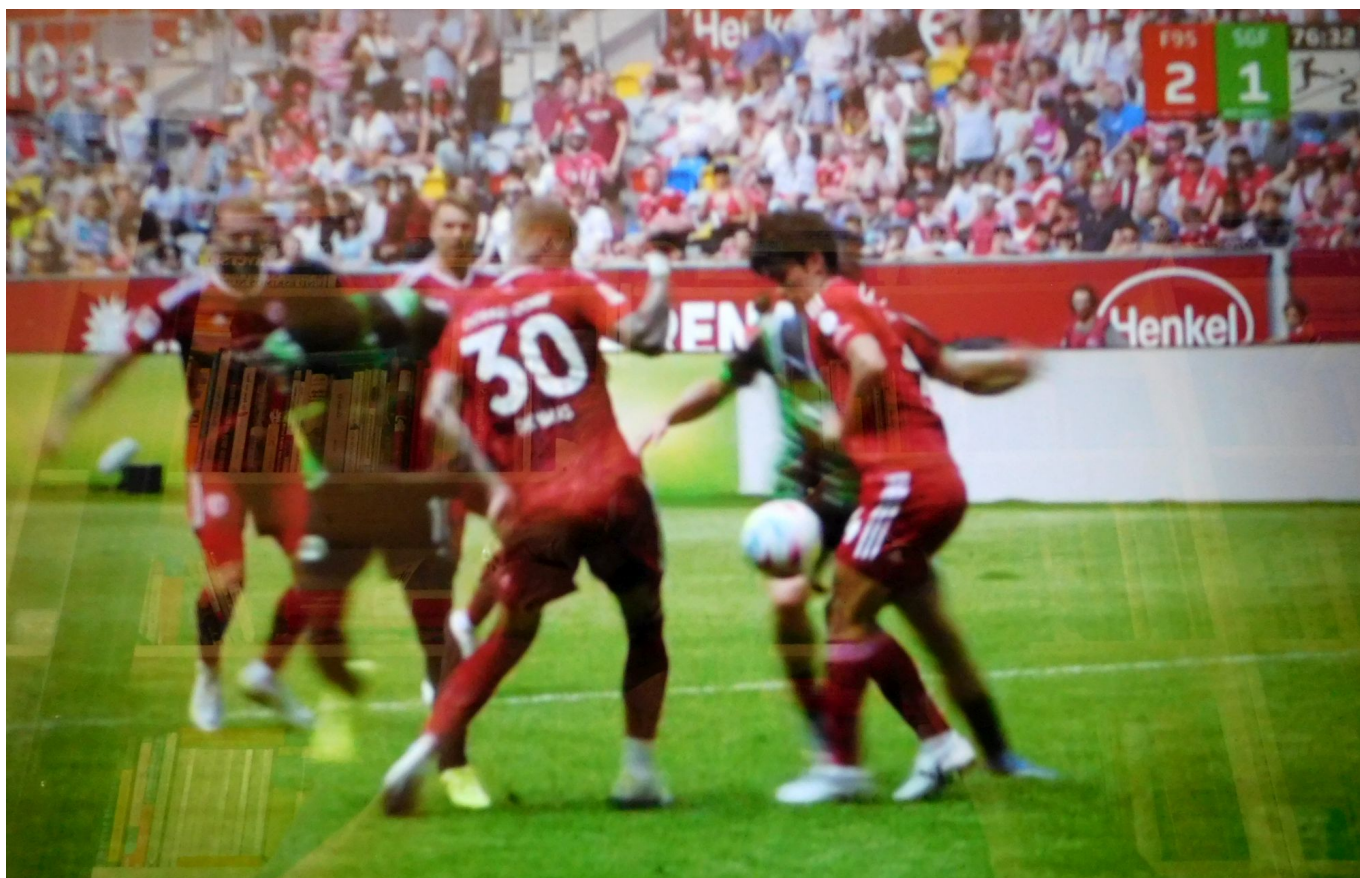
F95 vs Fürth: Die Szene, die zum Elfer für Fürth führte

Es gibt Strafstoß, aber so richtig klar, ob fürs Handspiel oder fürs Foul, wird die Sache nicht. Der Elfer ist drin, keine Chance für Kastenmeier. Das ist besonders bitter, weil die Jungs in Rot bis zu diesem Kuddelmuddel im eigenen Strafraum das Spiel wieder ganz gut im Griff hatten. Nun steht's unentschieden, und es bleibt - inkl. Nachspielzeit - noch eine knappe Viertelstunde. Und in dieser Phase hagelt es Chancen, von denen aber leider, leider keine zum Siegtor führt. Und daran trägt noch nicht einmal irgendwer die Schuld.