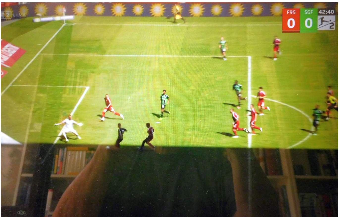
F95 vs Fürth: So macht man es dem Gegner leicht – Tor zum 0:1