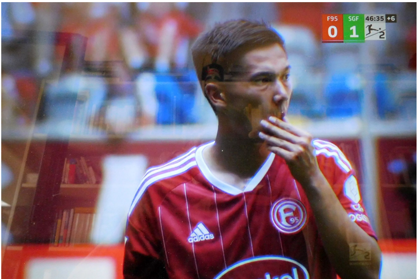
F95 vs Fürth: Shinta manchmal ratlos (Screenshot Sky)

Saison in den drei Bundesligen gezeigt - verlagern sich bloß vom Platz in die Kölner Gruft. Denn eigentlich sind die „Empfehlungen“ der Videoschiedsrichter ausschließlich in Sachen Abseits halbwegs gerecht. Nur bräuchte man für die ominöse „kalibrierte Linie“ gar keinen VAR, das könnte ein KI-Algorithmus auch.