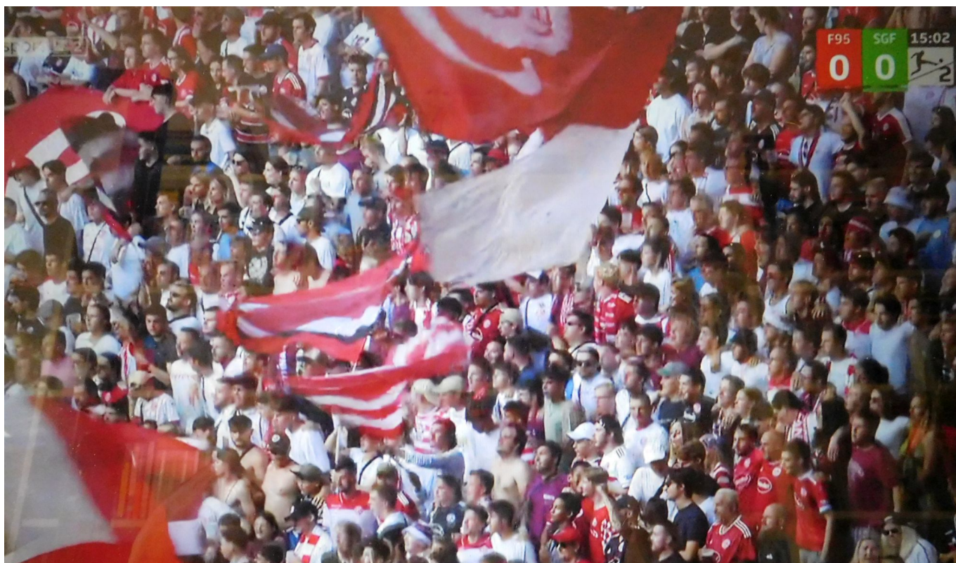
F95 vs Fürth: Unermüdlicher Support auf der Süd