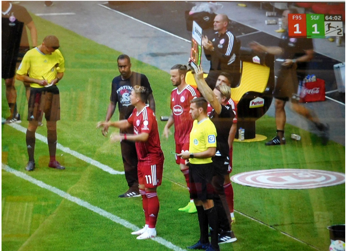
F95 vs Fürth: Vor den Wechseln