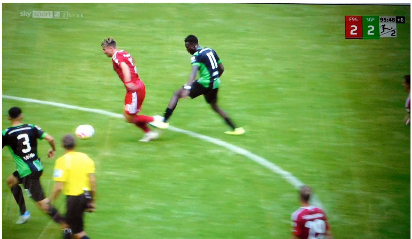
F95 vs Fürth: Ein letztes Foul der Fürther