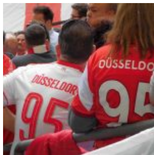
2 x 95