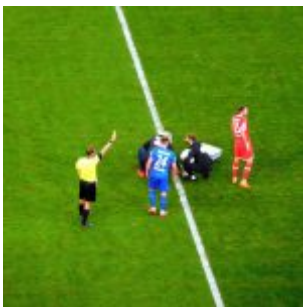
F96 vs HDH: Gelb für Blau (Hinspiel 2020)