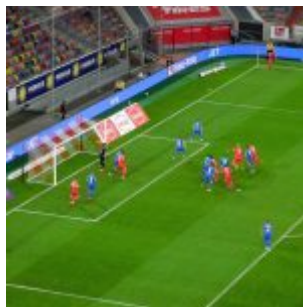
F95 vs HDH: Ecke ... Tor (Oktober 2020)