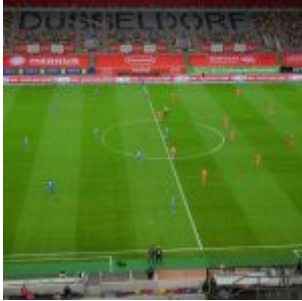
F96 vs HDH: Rot gegen Blau