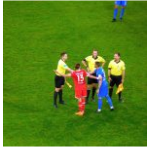
F96 vs HDH: Kurz nach Schluss