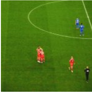
F96 vs HDH: Leicht unterkühlter Siegestaumel