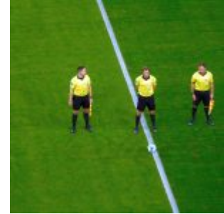
F96 vs HDH: Die Schiris