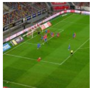
F96 vs HDH: Flanke von links