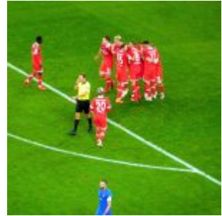
F96 vs HDH: Leicht verfrühter Torjubel