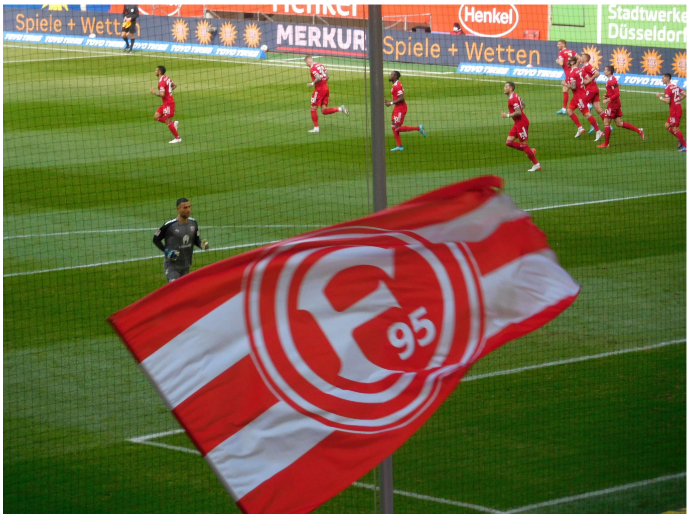
F95 vs Ingolstadt: Die Jubeltraube nach dem wunderschönen 1:0

Wo die Bande unter einem gewissen Herrn Preußner eigentlich ausschließlich über die Flügel und dortige Flanken kam, zeigen (fast) alle Kollegen einen Zug ins Zentrum und trauen sich endlich auch Distanzschüsse zu. Einer davon muss nun bald mal reingehen, quasi als Lohn der Arbeit. Stattdessen aber flogen die Eier aus der Ferne gern in die dritte Etage über der Hütte oder meterweise links und rechts vorbei. Da ist Optimierungsbedarf, da ist gezieltes Schusstraining angesagt. Apropos: Unter der Woche hatten die Coaches die Kicker stundenlang das Passspiel – bevorzugt in der One-Touch-Variante – üben lassen. Das hat sich ausgezahlt, denn eine Passquote von 86 Prozent oder besser gab's in dieser Saison erst zweimal vor dieser Begegnung.