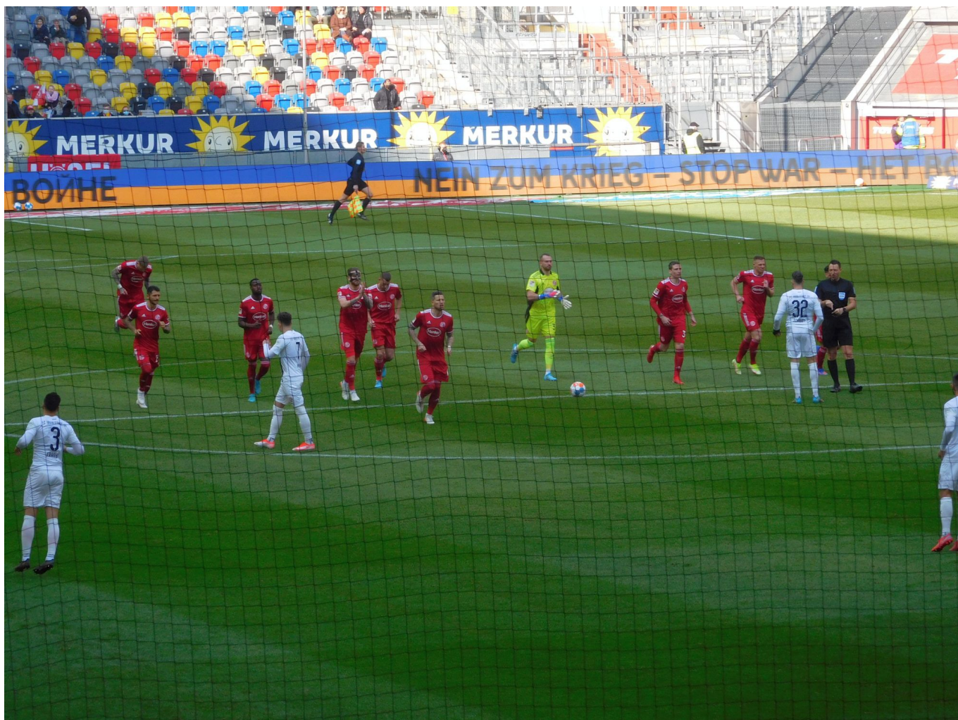
F95 vs Ingolstadt: Los geht's - kurz nach dem Anpfiff