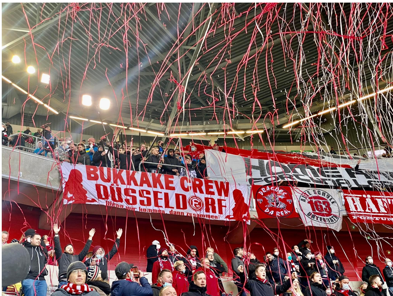
F95 vs Ingolstadt: Gänsehaut – endlich mal wieder eine Choreo...