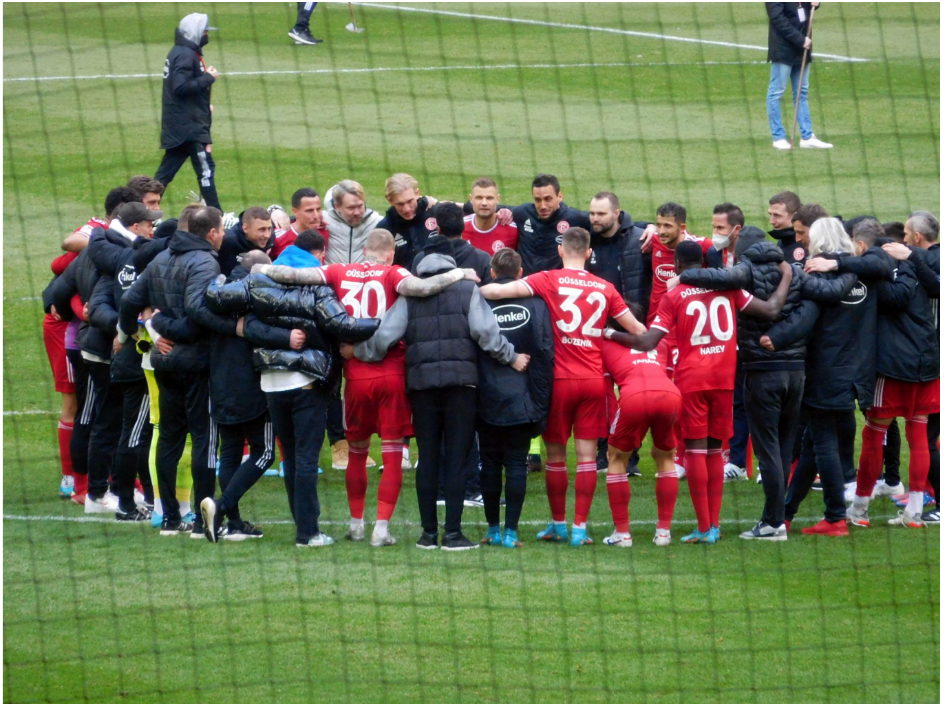
F95 vs Ingolstadt: Die Teambesprechung nach dem Schlusspfiff