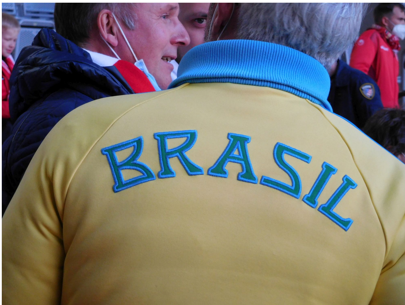
F95 vs Ingolstadt: Richtige Farben, falsches Land...