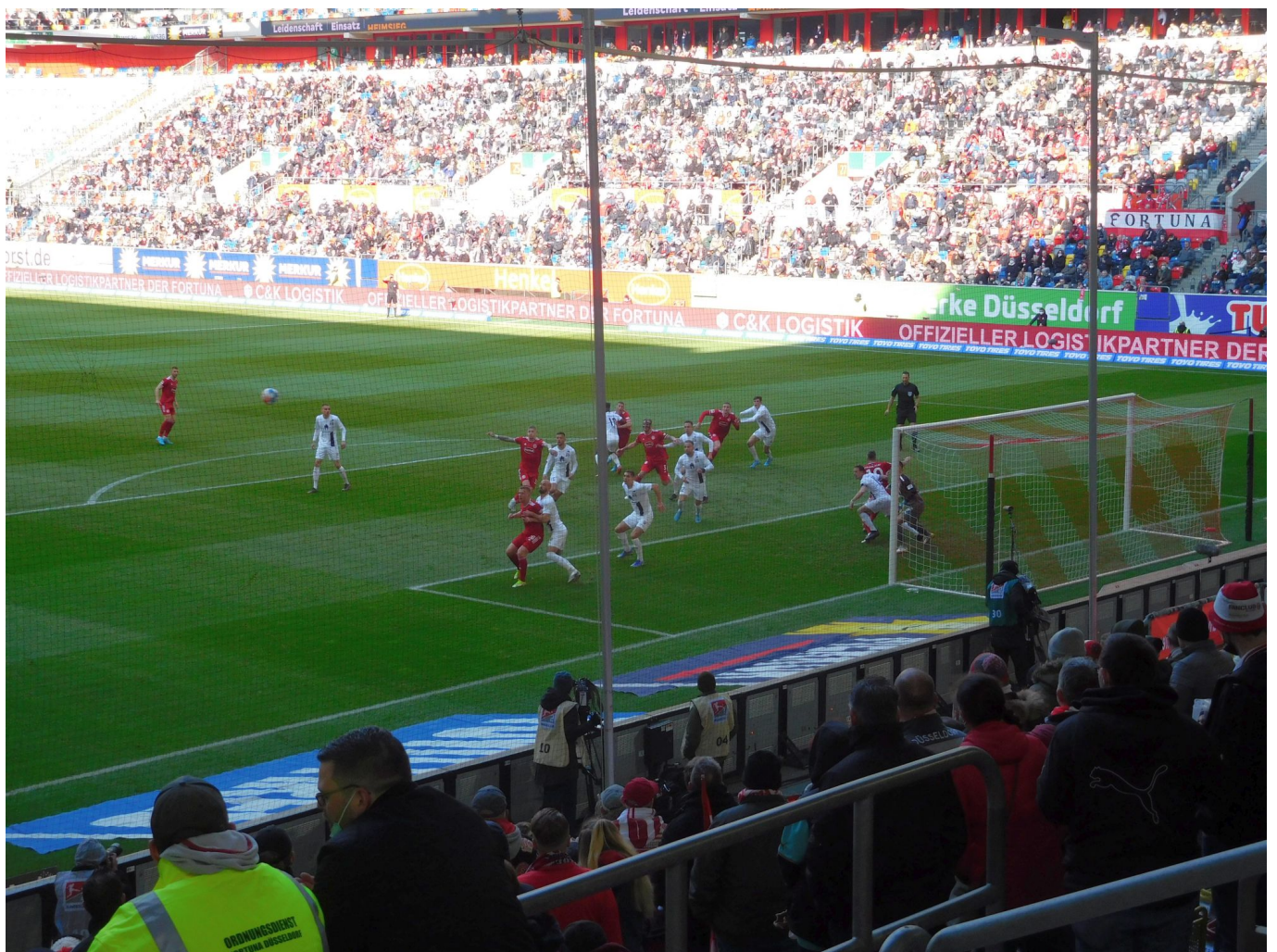
F95 vs Ingolstadt: Strafraumszene ohne Torerfolg