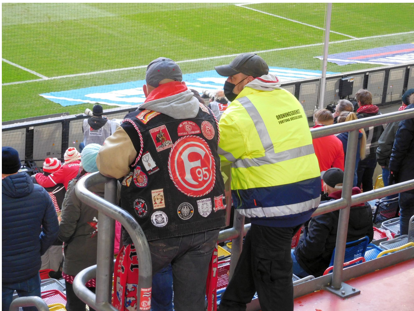
F95 vs Ingolstadt: In der Pause beim Fachsimpeln