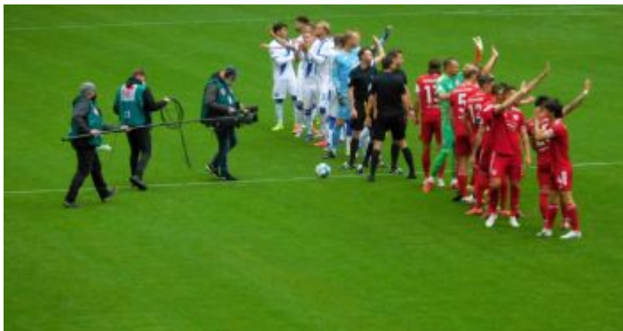
F95 vs KSC: Die Servicekräfte begrüßen die Gäste