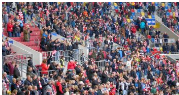
F95 vs KSC: Gute Stimmung im Restaurant „Fortuna“