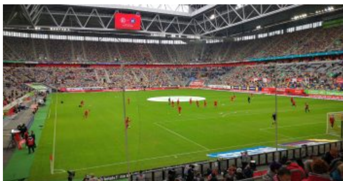
F95 vs KSC: Es ist angerichtet