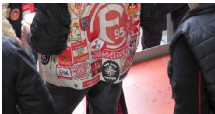
F95 vs KSC: Alter Stammgast im Restaurant „Fortuna“

Unentschieden ging es in die Pause, zum Glück „nur“ unentschieden, denn in der 41. Minute gehen bei Zimbo Zimmermann kurz die Kontrollleuchten aus, und er fabriziert einen Rückpass auf Kastenmeier, der zu leichter Beute für diesen Hofmann im KSC-Dress wird. Der geht frei auf Flo zu, der genau richtig rausläuft, sich breit macht, ohne einen Tunnel zu eröffnen und den Schuss in Weltklassemanier abwehrt. Apropos: Den gefürchteten Knipser hatten die Fortunen – bis auf diese eine Szene – jederzeit im Griff. Tatsächlich nahmen sie ihn ab der Mittellinie in eine Art milde Manndeckung, wobei er in der Regel von Käpt’n Bodze zuerst abgedeckt wurde, der ihn dann je nachdem von Hartherz oder Oberdorf übernehmen ließ – ein perfektes Rezept!