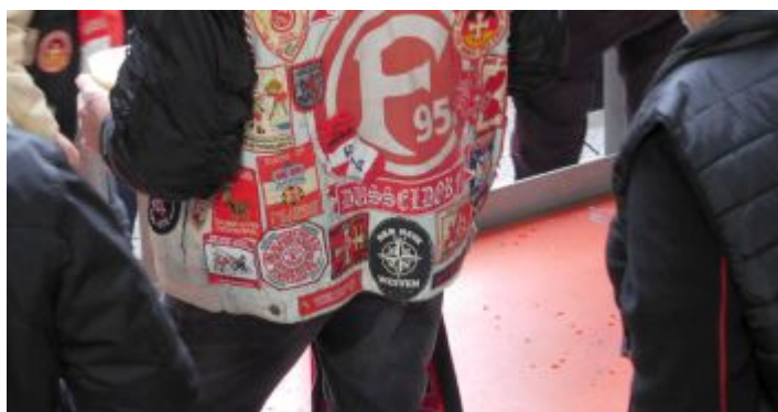
F95 vs KSC: Alter Stammgast im Restaurant „Fortuna“