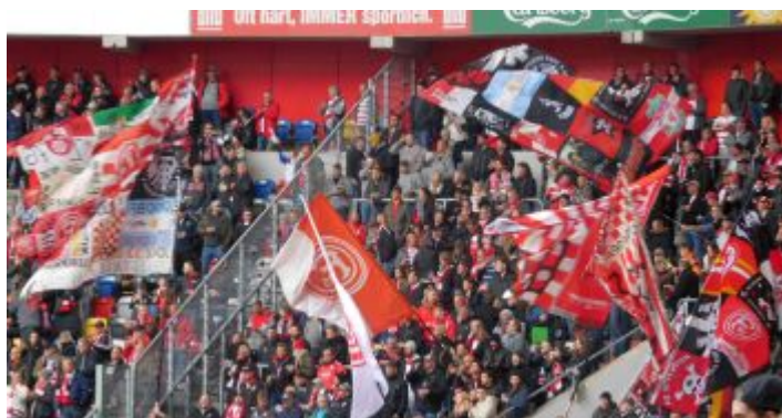
F95 vs KSC: Gourmets im Rausch nach dem dritten Gang

Das Stadion flippt kollektiv aus, viel Bier ist in der Luft, und auf der Süd hat tatsächlich jemand Pilsmanschetten aus Papier dabei, die er freudig erregt emporschleudert. Es ist beinahe wie früher. Zumal sich auf den Stehplätzen immer mehr bekannte Gesichter einfinden, die sich Arenabesuche bisher verkniffen haben. Dementsprechend entwickelt sich auch die Stimmung im Block – ein großer Teil des Repertoires an Gesängen und Parolen wird gestartet; nicht immer steigen genug Kehlen ein, um es richtig krachen zu lassen, aber: Auch die Fans sind auf dem richtigen Weg. Bei manchen Wechselrufen wünscht man sich die strukturierende Trommel der Ultras, aber insgesamt vermisst man die Pauke weniger als die stimmungsgewaltigen Kerle von UD (und Konsorten).