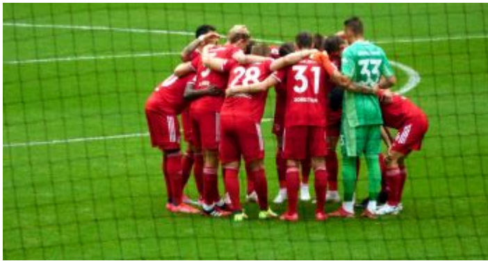
F95 vs KSC: Die Speisefolge wird besprochen

man, dass er permanent anspielbar ist und immer sofort sieht, wohin die Reise gehen könnte. Und in die Zweikämpfe geht er inzwischen auch deutlich beherzter.