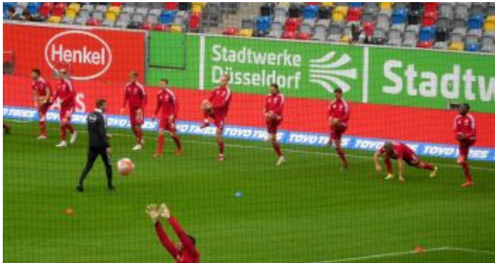
F95 vs KSC: Die Küchenmannschaft macht sich schon mal warm

Hennings und Narey, aber es war dann der weißblaue Philip Heise, der das Ding zum Eigentor reinmachte.