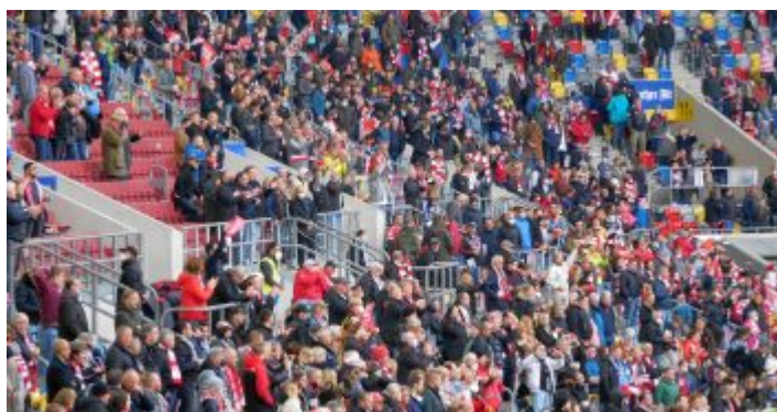
F95 vs KSC: Gute Stimmung im Restaurant „Fortuna“