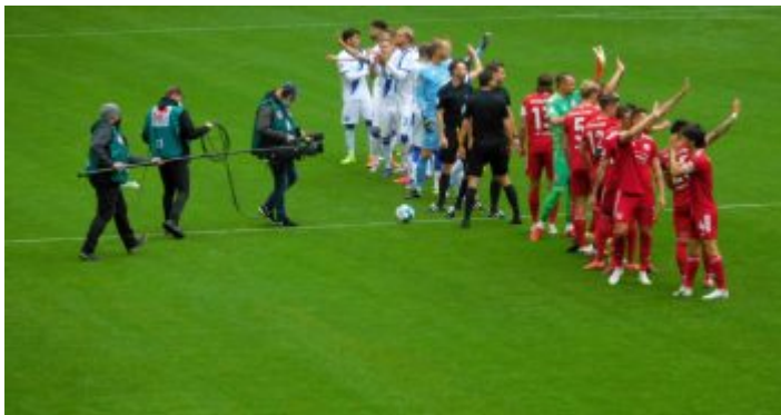
F95 vs KSC: Die Servicekräfte begrüßen die Gäste