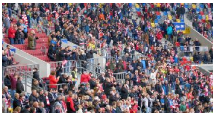
F95 vs KSC: Gute Stimmung im Restaurant „Fortuna“