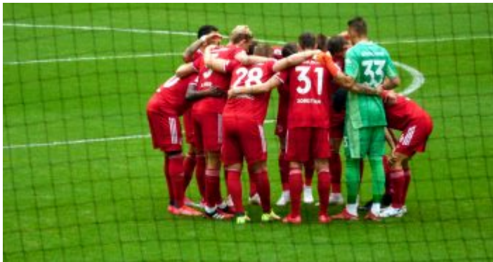
F95 vs KSC: Die Speisefolge wird besprochen

man, dass er permanent anspielbar ist und immer sofort sieht, wohin die Reise gehen könnte. Und in die Zweikämpfe geht er inzwischen auch deutlich beherzter.