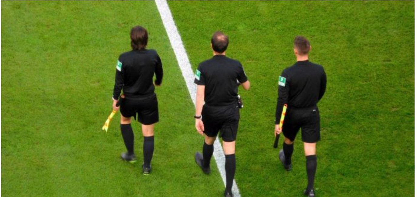
Zwei Herren, eine Dame in Schwarz - einer davon spinnt