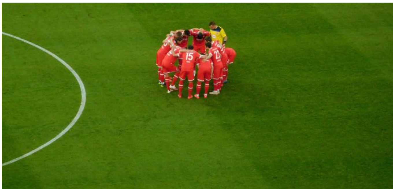
Die inzwischen übliche Beschwörungsrunde