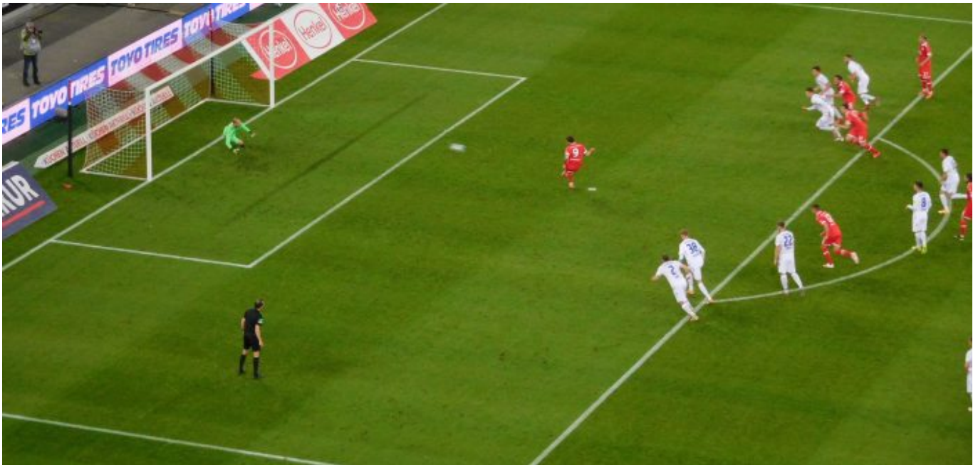
Den Elfer haut er rein, der tragische Dawid K.