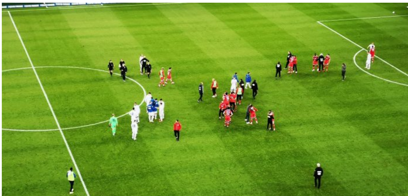
Der Glücksmoment nach dem Abpfiff – leider ohne Humba

Es ist einer dieser Fortuna-Momente, in der Berge durch puren Glauben versetzt werden. Zugegeben sind die selten, aber wenn sie stattfinden, sind sie atemberaubend schön. 3:2 in der letzten Nachspielminute. Die Roten treffen sich feiernd in der Ecke, Flo kommt über den ganzen Platz gerast, eine Traube, ein Haufen, Vibrations von purer Freude. Uwe Rösler flippt völlig aus, setzt aber nicht – wie weiland Nobert Meyer, der sich auf einen solchen Haufen Spieler warf – zum langen Spurt an. Axel Bellinghausen hat eine rote Birne, dass man meint, er würde gleich platzen. Und während in der rechten Spielfeldhälfte verhalten gefeiert wird, spazieren Trainer UR und Käpt'n AB auf der linken Seite übers Gras, und der Coach erklärt dem Bodze gestenreich, was er demnächst besser machen könnte