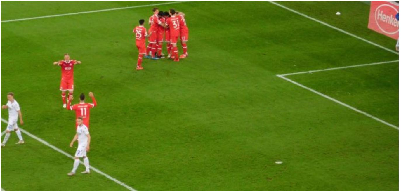
Der Alles-wird-gut-Jubel nach dem 2:1

Gehäuse. Ein wunderbares Tor unter der maßgeblichen Beteiligung von gleich drei der vier eingewechselten Kollegen. So, da haben wir also die inzwischen verdiente Führung. „Alles wird gut“ flöten wir nach Art der Broilers.