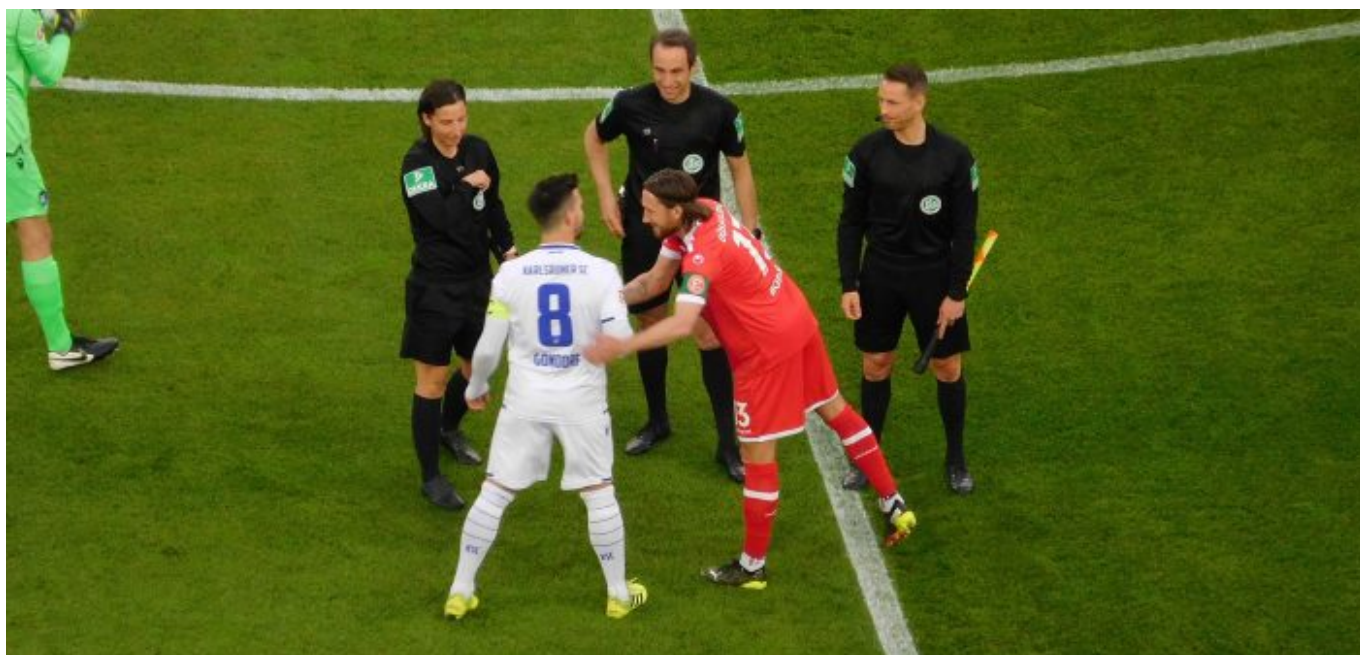
Käpt'n Bodze in bestechender Form – schon vor dem Anpfiff

Nur in der 13., da hätte es scheppern können, denn Cello haut einen aus relativ spitzem Winkel raus, den der Karls-Keeper mit dem Fuß abwehrt, sodass Eddie von hinten schießen müsste, Eddie schießt, und ... kein Tor! Tor! Tor. In der 18. Minute gab es den üblichen Kastenmeier-Moment, als der Flo den Abstoß an einen dort verweilenden Karlsruher ballert; die Pille springt zum Glück ins Aus. Hätte schiefgehen können.