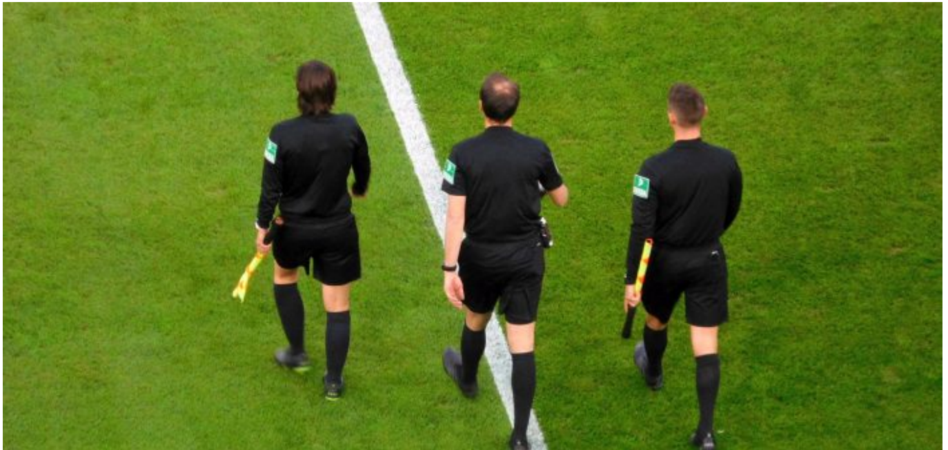
Zwei Herren, eine Dame in Schwarz - einer davon spinnt