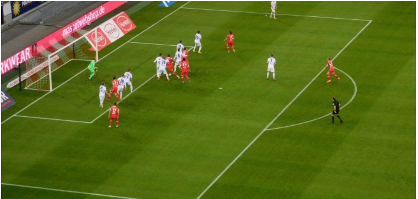
Ein typische Flanke aus der ersten Halbzeit