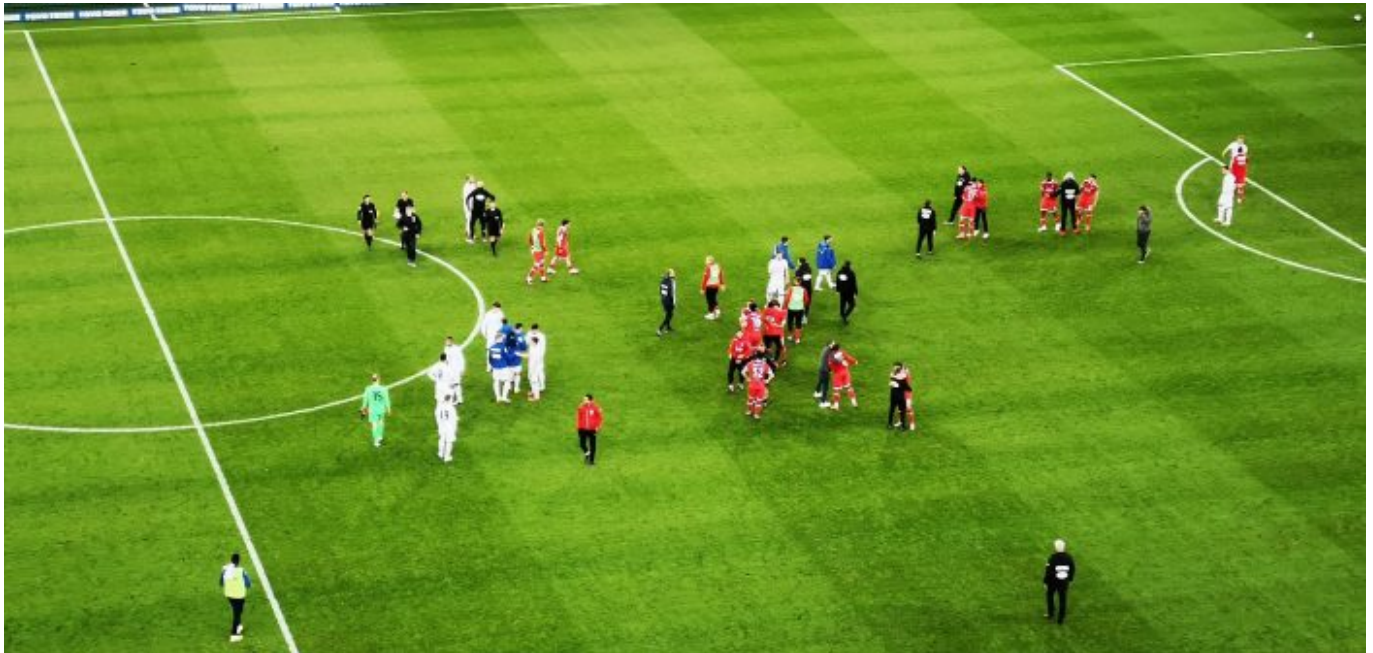
Der Glücksmoment nach dem Abpfiff – leider ohne Humba

Es ist einer dieser Fortuna-Momente, in der Berge durch puren Glauben versetzt werden. Zugegeben sind die selten, aber wenn sie stattfinden, sind sie atemberaubend schön. 3:2 in der letzten Nachspielminute. Die Roten treffen sich feiernd in der Ecke, Flo kommt über den ganzen Platz gerast, eine Traube, ein Haufen, Vibrations von purer Freude. Uwe Rösler flippt völlig aus, setzt aber nicht – wie weiland Nobert Meyer, der sich auf einen solchen Haufen Spieler warf – zum langen Spurt an. Axel Bellinghausen hat eine rote Birne, dass man meint, er würde gleich platzen. Und während in der rechten Spielfeldhälfte verhalten gefeiert wird, spazieren Trainer UR und Käpt'n AB auf der linken Seite übers Gras, und der Coach erklärt dem Bodze gestenreich, was er demnächst besser machen könnte