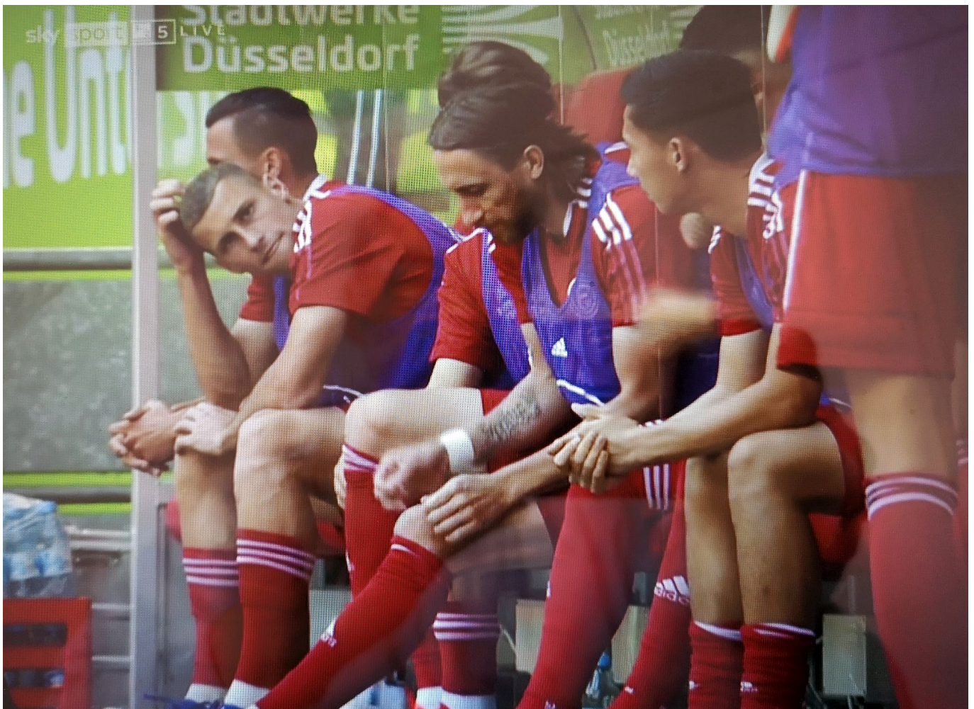
F95 vs R'burg: Auf der Bank