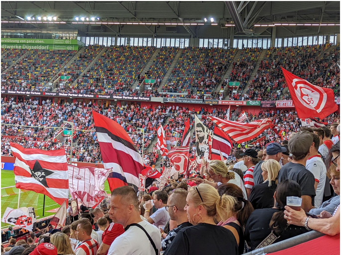
F95 vs Regensburg: Die Stimmung im 40er

Dass die Coaches in der 84. Minute alle Torschützen auswechselten, sah kurios aus, hatte aber keinen mit ihren Treffern zusammenhängenden Grund. Rouwen Hennings für den kampfstarken Ginczek zu bringen, war logisch. Der Wechsel von Klaus auf Baah ebenfalls. Unseren Emma lyoha anstelle von Dawid Kownacki ins Spiel zu schicken, verfolgte aber ein etwas weiter ausgreifendes Ziel, nämlich dem bei der Fortuna groß gewordenen Stürmer zu signalisieren, dass man auf ihn setzte, und den dummdreisten Pressevertretern eins überzubraten, die Gerüchte in die Welt gesetzt haben, lyoha wäre quasi schon verkauft.