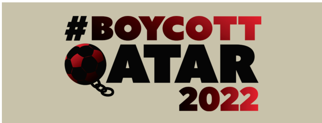
Boycott Qatar 2022

ein Remis würden die Signale auf Spitzengruppe stellen, eine Niederlage je nach den Resultaten der anderen den angesprochen Sturz in die untere Tabellenhälfte. Bleiben wir einfach optimistisch.