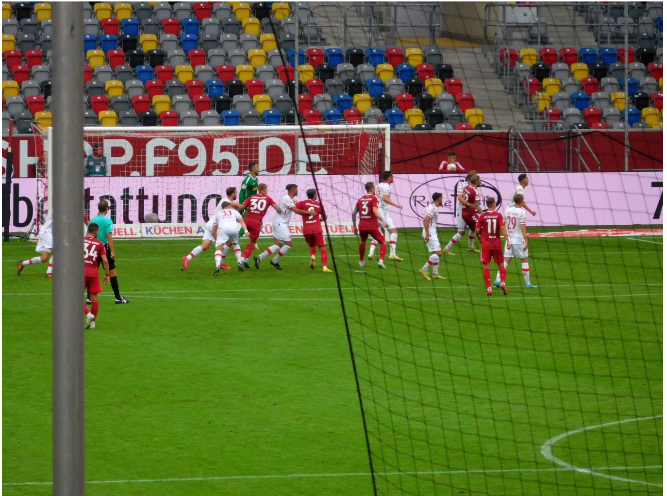
F95 vs Regensburg: Eine Ecke in Halbzeit Eins