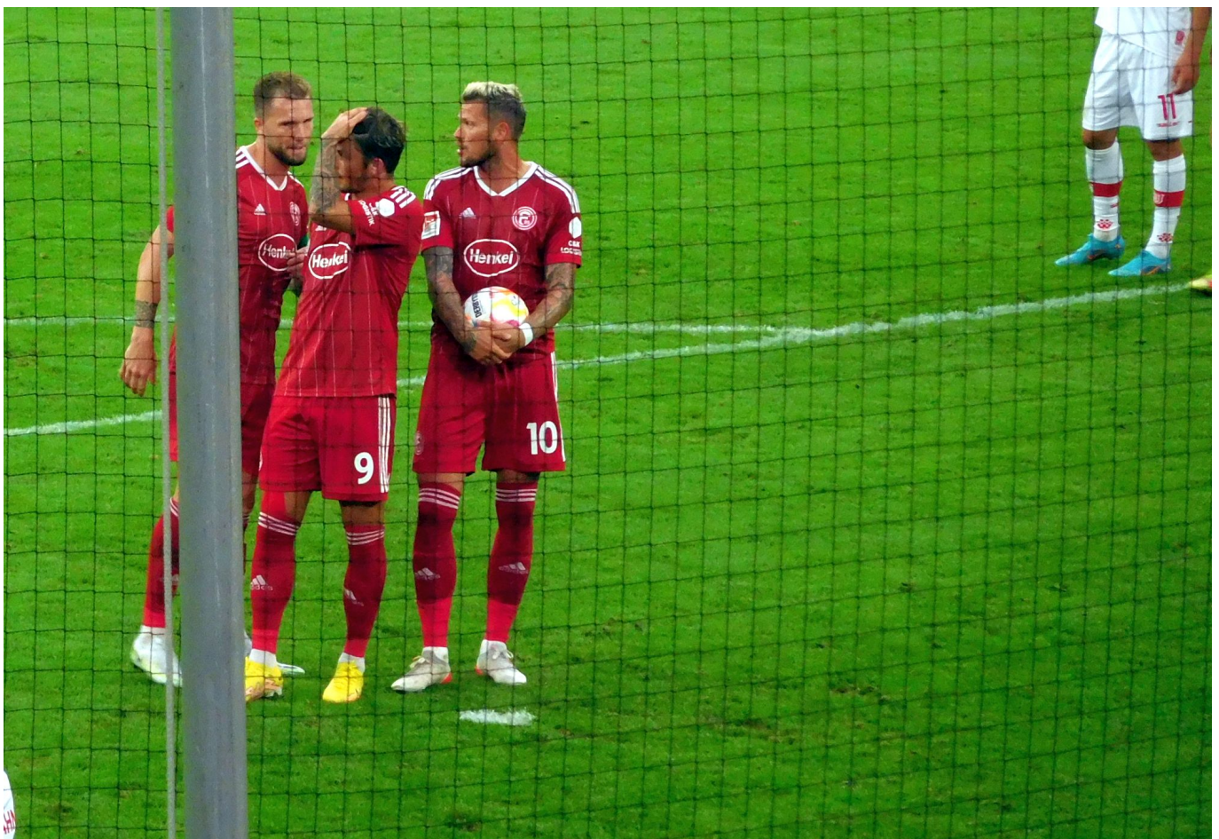
F95 vs Regensburg: Wer soll den Elfer schießen