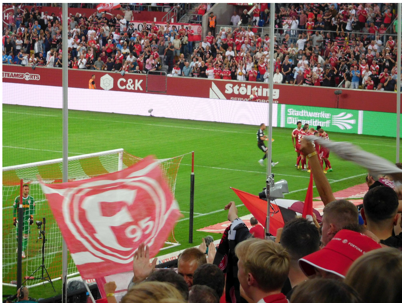
F95 vs Regensburg: Jubel nach dem, 4:0