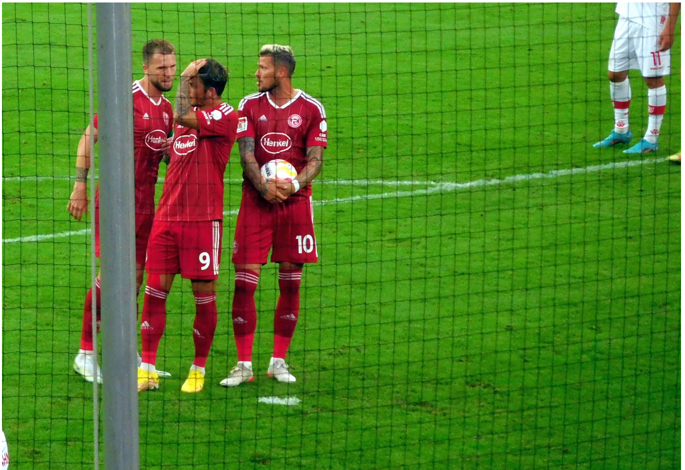
F95 vs Regensburg: Wer soll den Elfer schießen