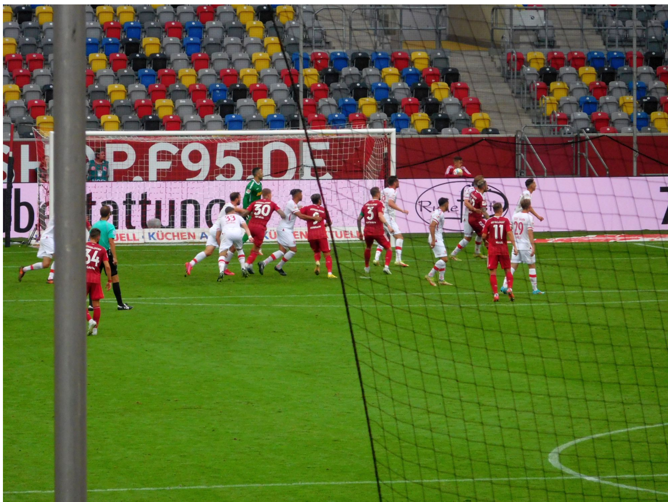
F95 vs Regensburg: Eine Ecke in Halbzeit Eins