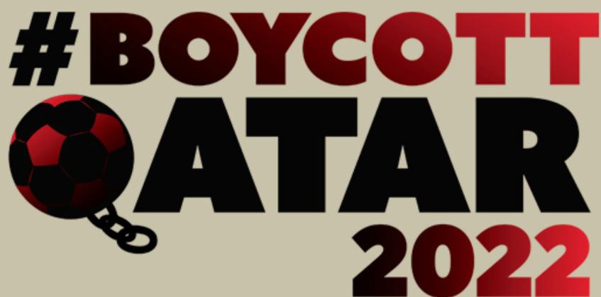
Boycott Qatar 2022

ein Remis würden die Signale auf Spitzengruppe stellen, eine Niederlage je nach den Resultaten der anderen den angesprochen Sturz in die untere Tabellenhälfte. Bleiben wir einfach optimistisch.