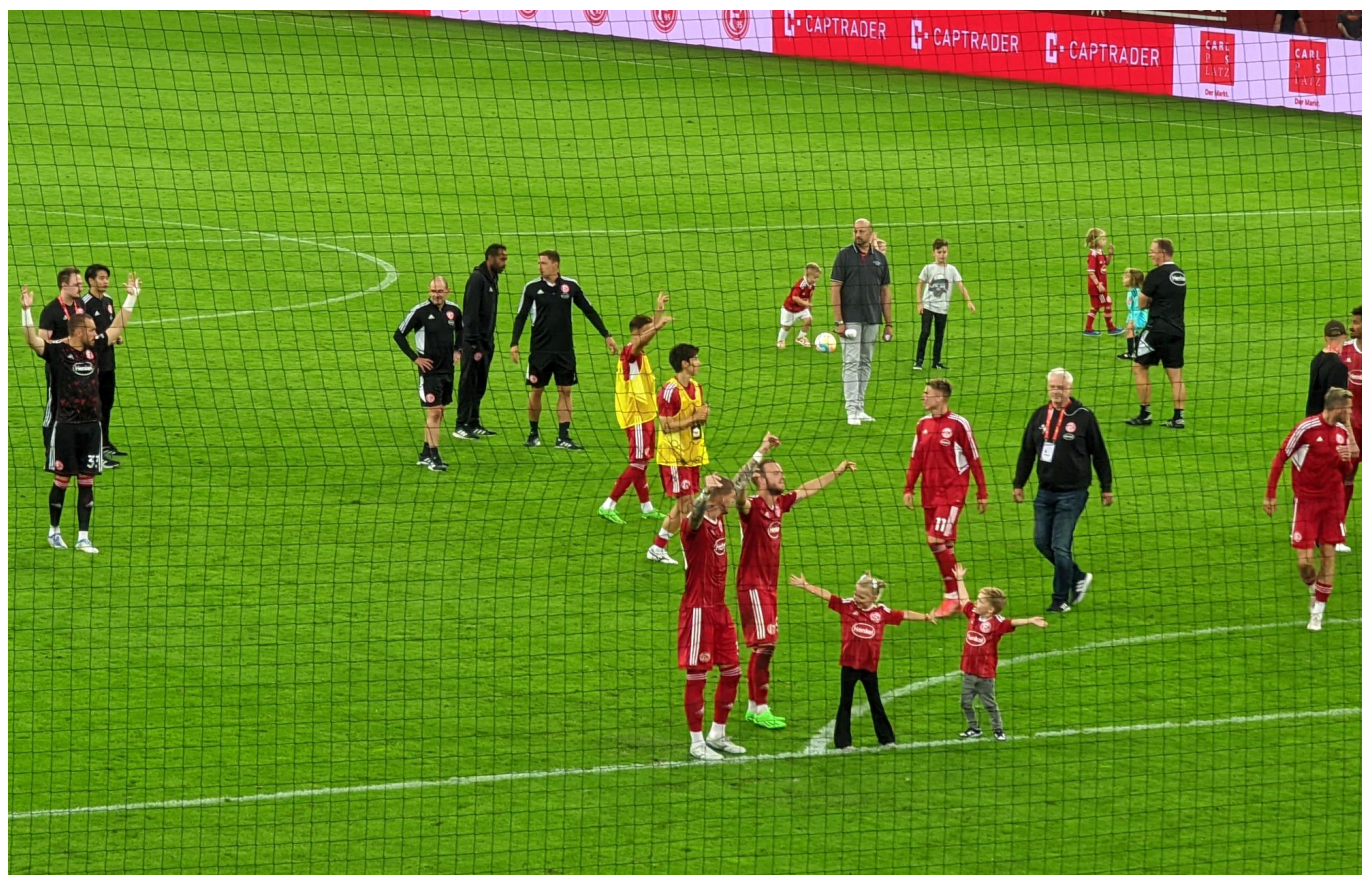
F95 vs Regensburg: For-Tu-Na!

sagen wir – ein wenig verhalten; es gab halt nichts zu feiern. Außerdem versuchen die Ultras gerade mit Macht ein sogenanntes „Kurvenlied“ durchzusetzen, dass den Rest der Süd einfach nicht interessiert. Solange sich euer Ergebener in der Nähe der Ultras aufhält, hat so etwas noch nie geklappt. Manche Gesänge sind halt ewig, andere blühen nie auf. Das ist so, da kann keiner was dran ändern. Einen Singsang durchpauken zu wollen, geht aber zulasten des Gesamtkunstwerks namens Support. So war es wieder einmal der Block 160 im Oberrang, der Klassiker anstimmte, die dann von den Blöcken 42, 41 und 40 mit Freude übernommen wurden.