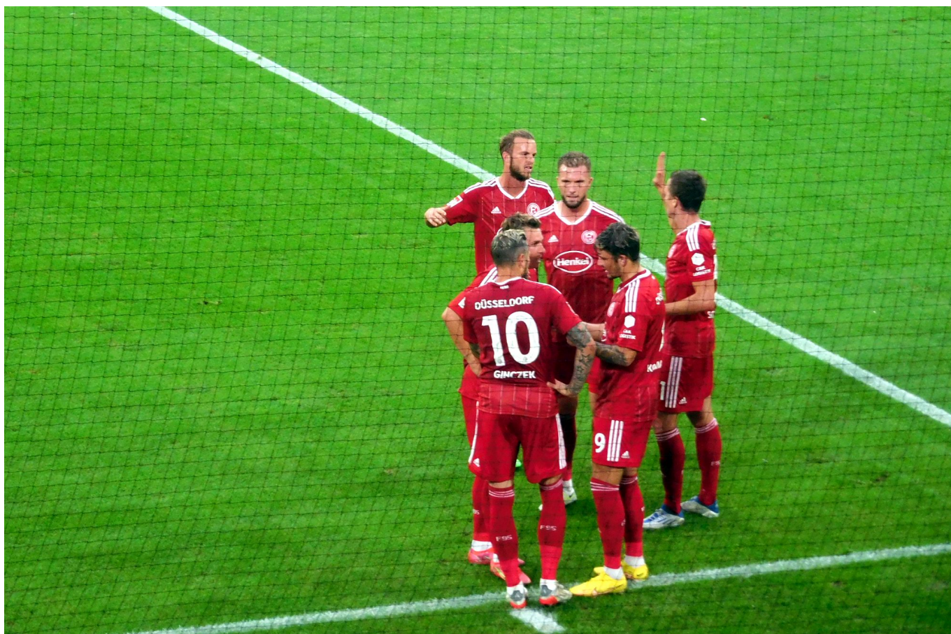
F95 vs Regensburg: Jubel nach dem 1:0