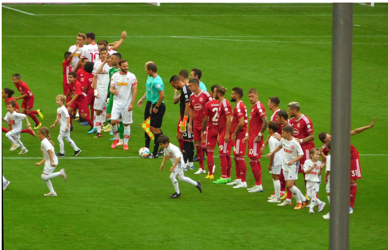
F95 vs Regensburg: Der Auflauf

Aber wenn eines sicher ist, dann dass die Regensburger ultraschwach im Torabschluss agieren. Die Tabelle spiegelt das wider, denn der SSV hat bisher lediglich fünf Treffer auf dem Konto; nur Braunschweig mit drei Toren steht schlechter da. Das Umschaltspiel kennen sie auch nur vom Hörensagen. Euer Ergebniser ist ohnehin der Ansicht, dass diese Kloppertuppe, die heikle Situationen grundsätzlich per Foul zu klären versucht, erheblich überschätzt wird.