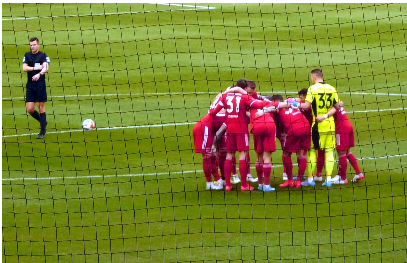
F95 vs S04: Der Motivationskreis vor dem Spiel hat gewirkt