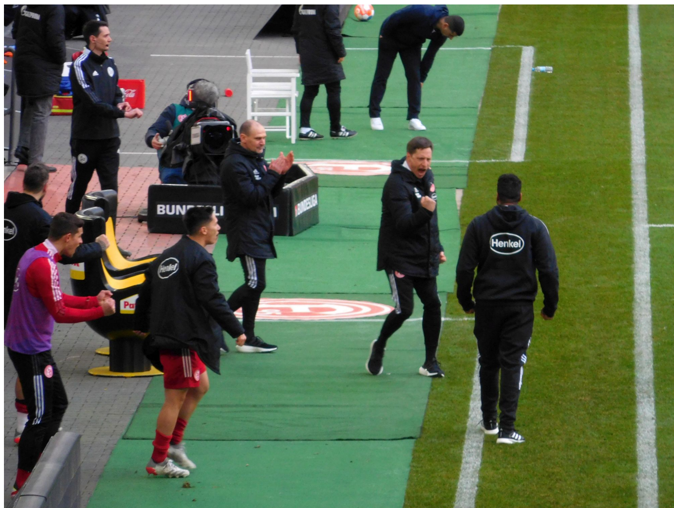
F95 vs S04: Die Freude der Trainer über den Heimsieg

der Arena war, brodelte es wie in den seligen Zeiten vor dieser beschissenen Corona-Seuche. Wenn es je eines Beweises bedurft hätte, wie wichtig anfeuernde Zuschauende gerade auch für die Fortuna sind, dann war es diese aufwühlende Begegnung gegen den Verlierer des Endspiels um die Deutsche Meisterschaft anno 1933 (...nur damit es jeder weiß...).