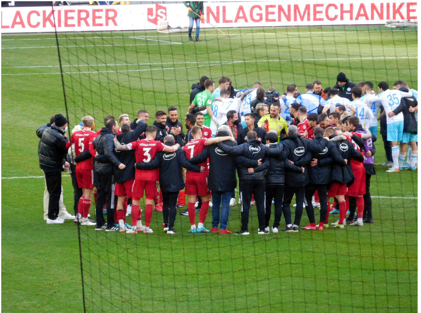
F95 vs S04: Thiune hält nach dem Spiel eine Rede

dem Abstieg zu tun haben, sondern allerschlimmstenfalls Relegation spielen müssen.