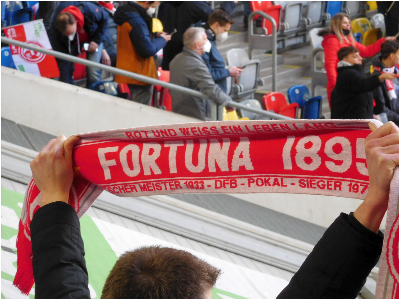
F95 vs S04: Endlich wieder Schals im Block - fast schon wie zu normalen Zeiten

Da hatte Cello Sobottka anderes zu tun: Der ordnete durchgehend das Mittelfeld, holte sich ein ums andere Mal die Pille vom Gegner und verteilte die Bälle im Aufbau. Schön, dass unser Aushilfskapt'n auf dem aufsteigenden Ast ist.