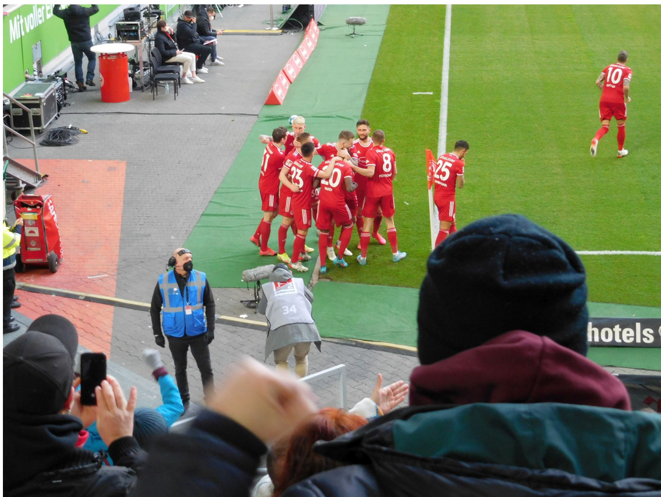
F95 vs S04: Die Jubeltraube nach dem Ausgleichstor

Aber ein Knotenplatzer war das noch lange nicht, das schienen auch die Spieler zu wissen, denn sie versuchten rasch nachzulegen. Zumal die Schalker merkwürdig lethargisch auf den Ausgleich reagierten. Erst nach dem Führungstreffer drehten sie ein bisschen auf, schoben vor und gaben Räume für Konter. So konnte Rouwen Hennings in der 53. Minute fast unbedrängt von der Sechzehnerkannte aus schießen, hatte die Pille aber auf dem falschen Fuß und bekam keinen Druck hinter den Schuss.