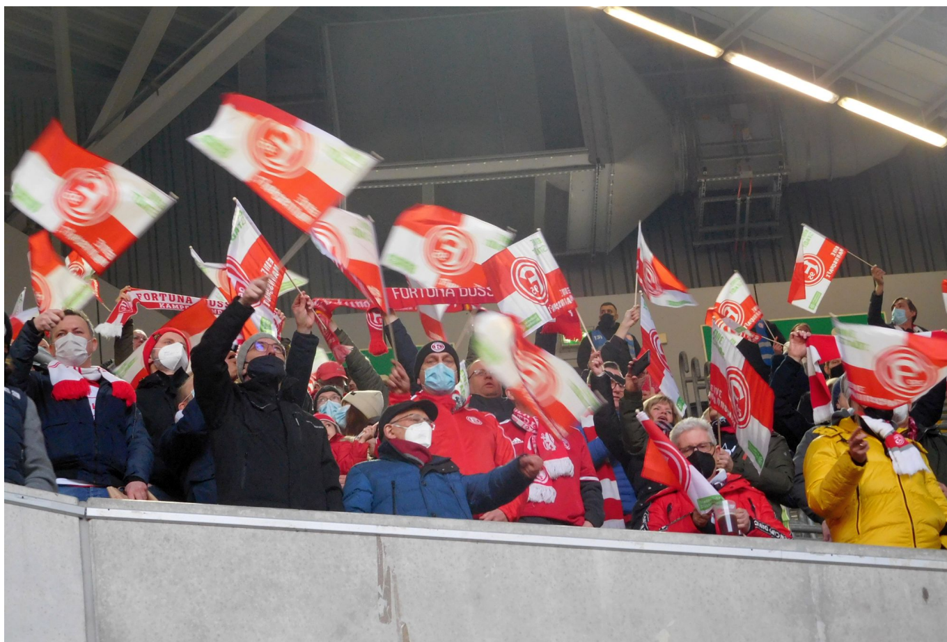
F95 vs S04: Das mit den Fähnchen...

Unsere Jungs hatten zu diesem Zeitpunkt Schalke voll im Griff. Angriff um Angriff lief, vorwiegend über rechts. Immer wieder Doppelpässe, an den Zimmermann, Narey und Ginczek beteiligt waren. Gavory weit vor. Appelkamp und Hennings zentral. Manchmal de Wijs weit vorne mit dabei. Da standen dann manchmal zehn Schalcker im eigenen Strafraum. Und dann sind die Roten drin in der Box. Zimmermann schiebt durch zu Narey, der aus der Drehung hinter die Masse der Verteidiger passt, wo Hennings wie einst im Mai goldrichtig steht und goldrichtig einnetzt.