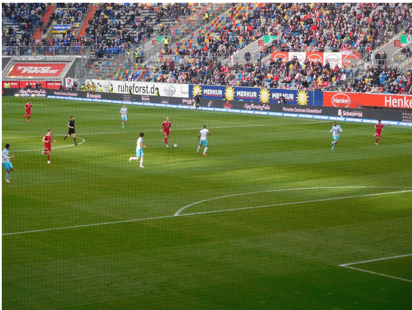
F95 vs S04: Einige Kontermöglichkeiten in der zweiten Halbzeit

Das hat man heute seinem Coaching neunzig Minuten lang angesehen. In der Pressekonferenz wurde er gefragt, ob er den legendären Patex-Stuhl freiwillig an seinen Co-Trainer abgegeben hat. Ja, sagte Thioune, er muss stehen beim Spiel. Dann sehen seine Spieler auch, dass er neunzig Minuten volle Kanne dabei ist – was für ein tolles Statement! Und gestanden hat er eigentlich kaum. Ständig tigerte er in seiner Zone hin und her, und mehrfach musste ihn der vierte Schiri wieder einfangen und in diese Box zurücktreiben. Das erinnerte ziemlich an seinen Vorgänger Uwe Rösler – wobei der deutlich mehr rumgebrüllt hat.