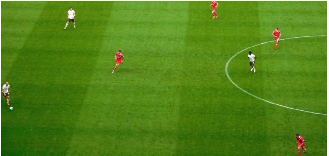
F95 vs St. Pauli: Sehr oft prima Pressing