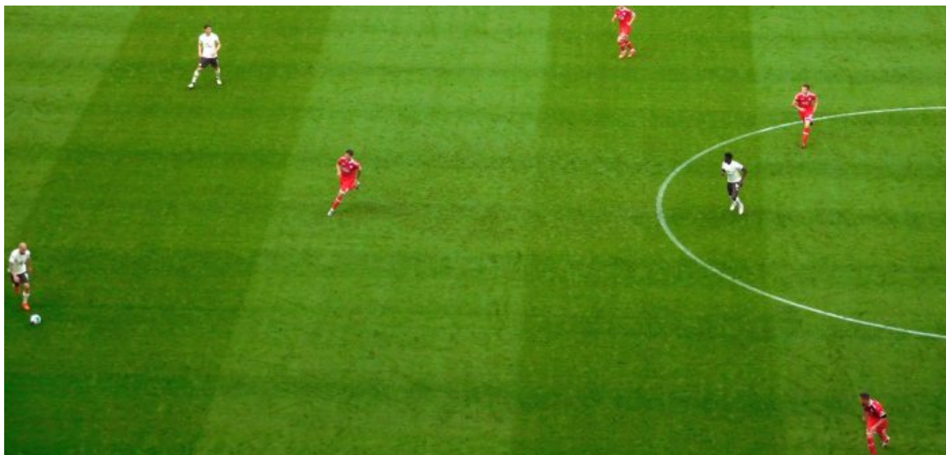
F95 vs St. Pauli: Sehr oft prima Pressing