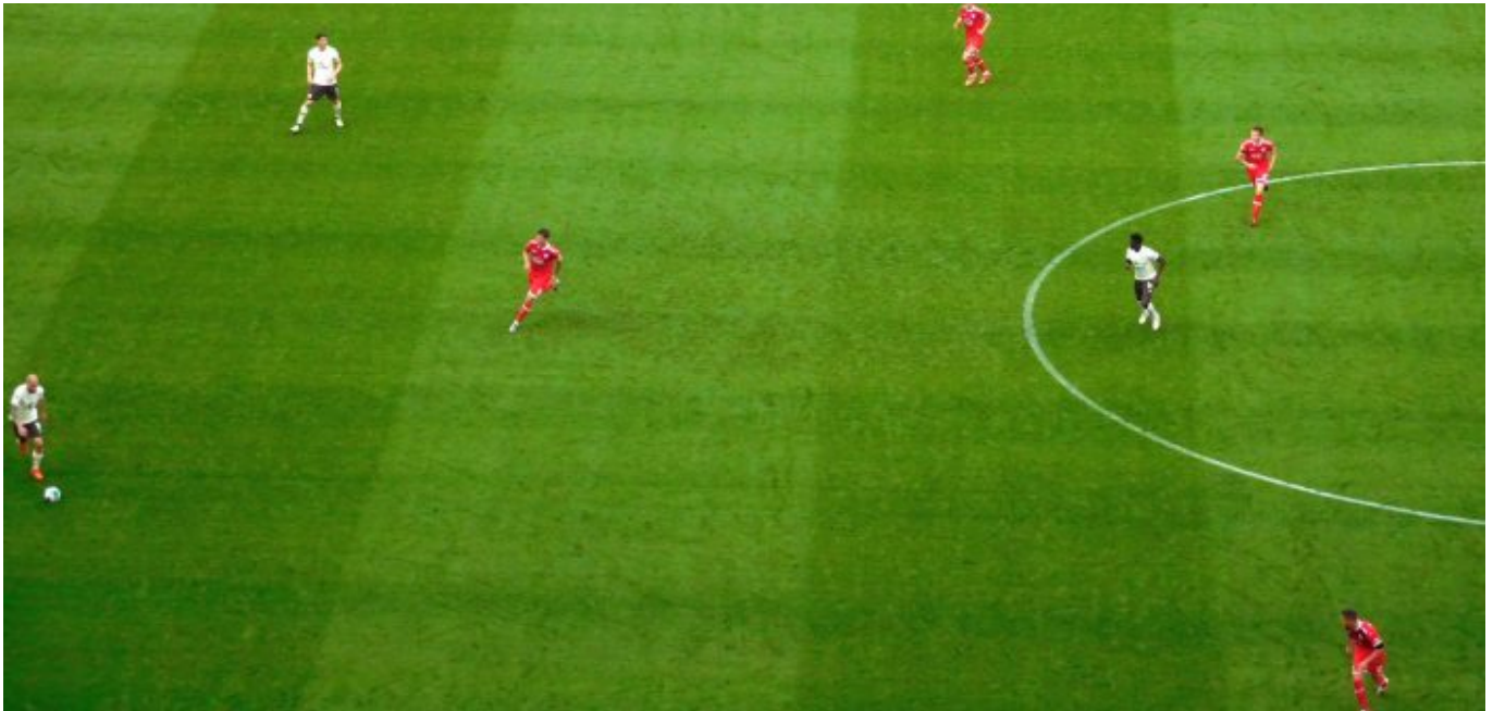
F95 vs St. Pauli: Sehr oft prima Pressing