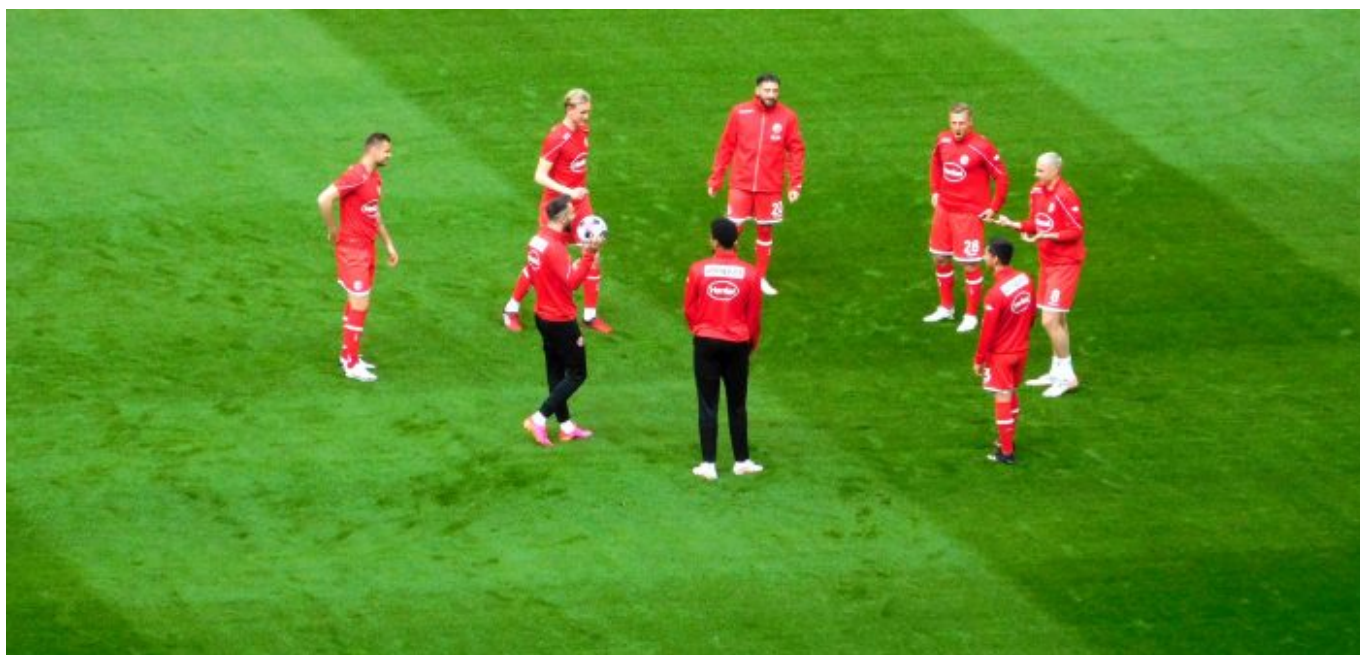
F95 vs St. Pauli: Auswechselfspieler beim Kreistanz