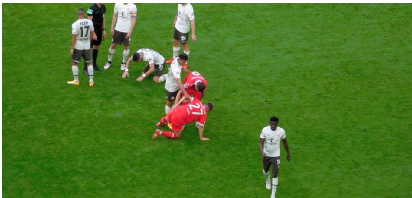
F95 vs St. Pauli: Gesunde Härte, unsanfter Zusammenstoß