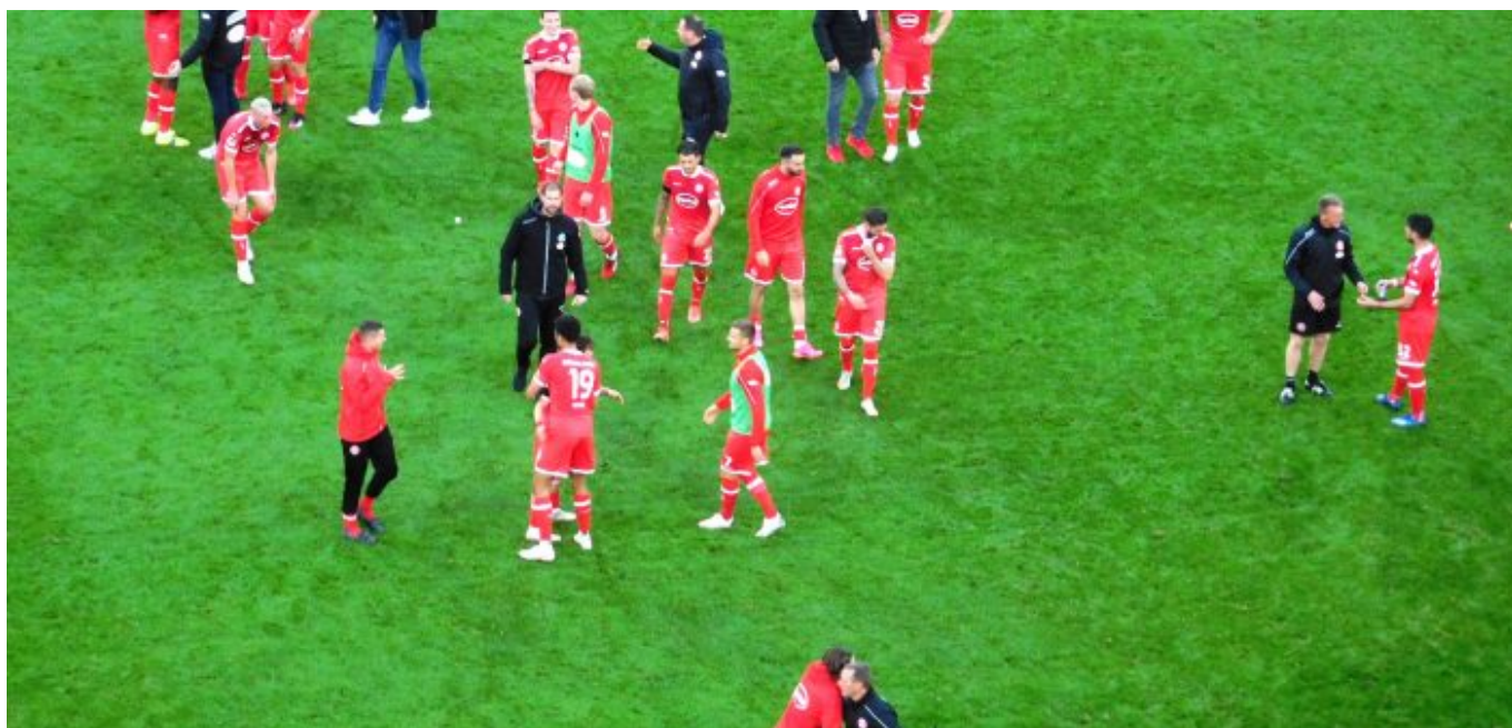
F95 vs St. Pauli: Die Sieger gehen fröhlich, aber gelassen vom Platz