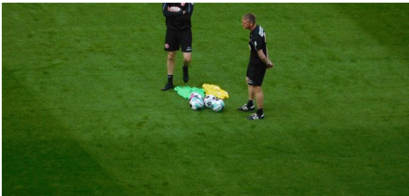
F95 vs St. Pauli: Co-Trainer beim Plausch (Foto: TD)

Aber, der Erfolg im Fußball ist ja immer eine Mischung aus individueller Klasse und dem passenden taktischen Gerüst. Zu der beschriebenen Dreierformation ganz vorne passte gestern die mittlere Dreierkette gut – zumindest auf dem Papier. Die Insassen dieser Kette agierten nun gerade nicht immer auf einer Linie, nur bei Ballbesitz des eigenen Teams. Ansonsten stand Käpt'n Bodze am tiefsten, Cello Sobottka bildet das frei marodierende Element, und Eddie Prib soll von der Zentralstelle aus walten. Tat er leider (wieder? erneut? wie immer?) nicht. Sein Anteil am Offensiven ging besonders in Hälfte Eins gegen Null. Dafür zeigte Cello (wieder? erneut? wie immer?), dass er sich auf der ihm nun endlich zugeteilten Position am wohlsten fühlt.