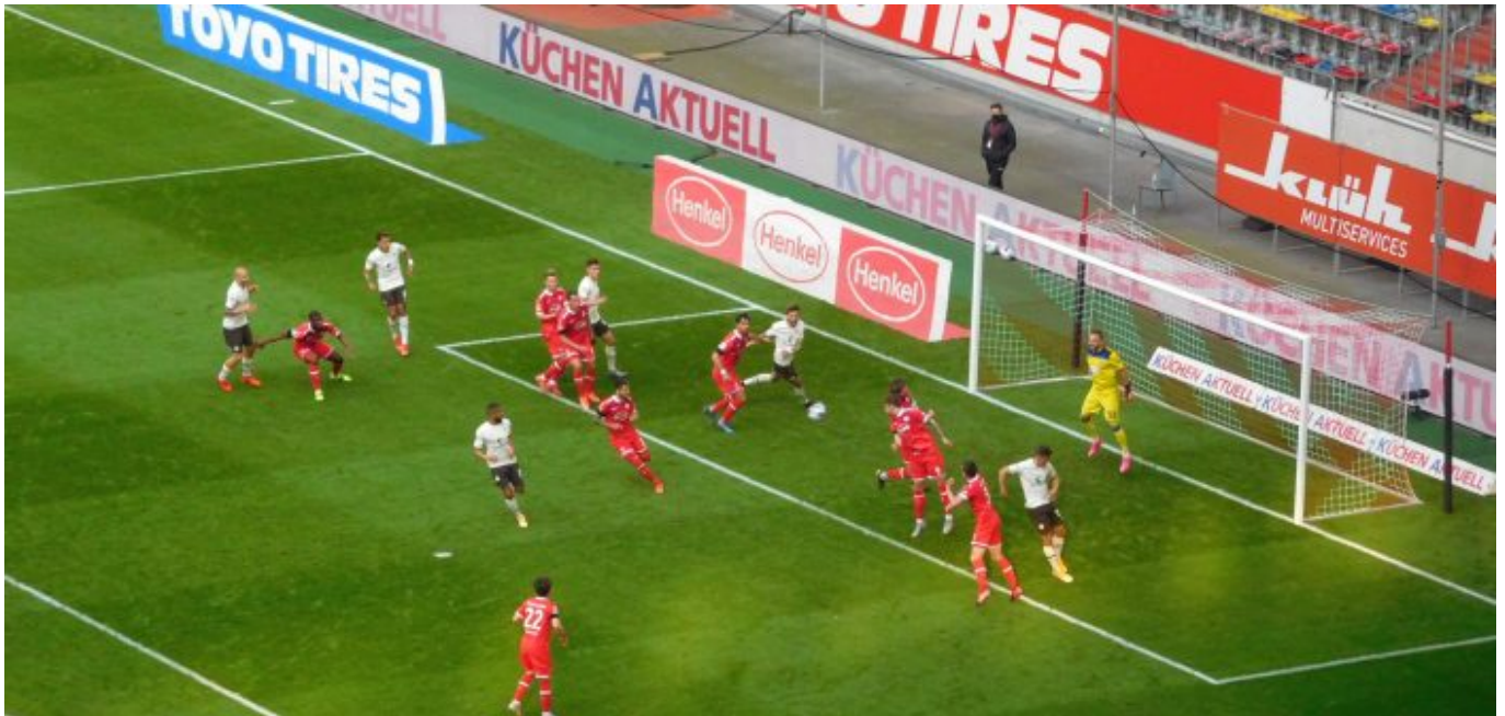
F95 vs St. Pauli: Ganz schön viel Pauli-Druck in den ersten 25 Minuten

Zeichen für eine flinke Fortuna-Zukunft.