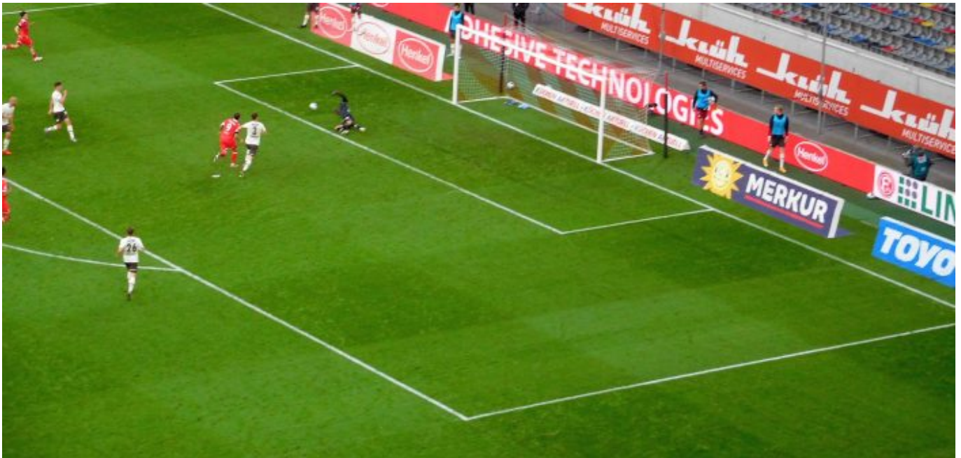
F95 vs St. Pauli: Pauli hatte auch Chancen

wäre auch unspektakulär gegangen), und auf den sonst üblichen Kastenmeier-Moment wartete ihr schwer Ergebener vergeblich. Auffällig, dass der Flo immer öfter auf der Linie bleibt und weniger mit dem Ball am Fuß riskiert. So wird er sicher ein Teil der Zukunft, die unsere glänzende Diva vor sich hat.