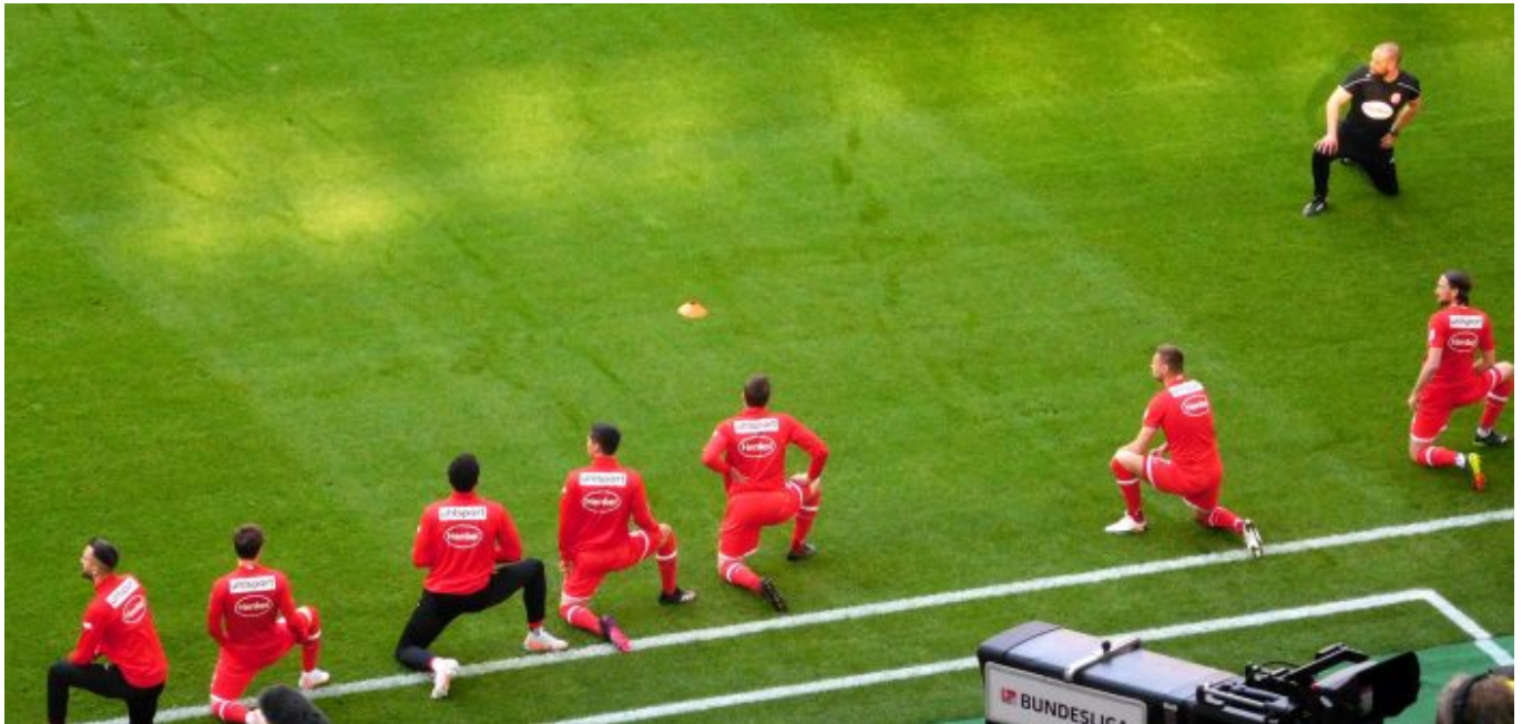
F95 vs St. Pauli: Aufwärmen vor Bundesliga-Kameras

Cheftrainer Uwe Rösler – über dessen Zukunft später noch zu reden sein wird – hatte völlig überraschend doch keine Überraschung auf das Frühlingsgrün im Inneren der immer noch ausgekühlten Arena geschickt. Ohne jetzt den Spruch von dem gewinnenden Team, das man niemals ändern sollte, zu zitieren: War aber so. Allerdings mit einer minimalen taktischen Verschiebung hin in Richtung auf ein echtes 4-3-3. Denn Dawid Kownacki mimte nicht die einzige Spitze, sondern agierte meist auf einer Linie mit den Außenkollegen Peterson und Felix Klaus. Ohne eine Gesamtbewertung aussprechen zu wollen: Das sah erheblich moderner aus als alles, was die Doppelspitze Hennings-Karaman in ihren besten Tagen auf den Platz gebracht. Wohlgedenkt: moderner, nicht unbedingt erfolgreicher.