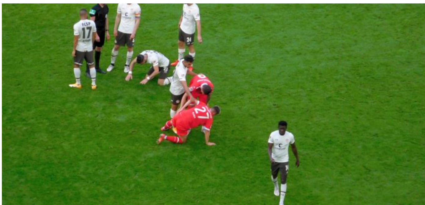
F95 vs St. Pauli: Gesunde Härte, unsanfter Zusammenstoß